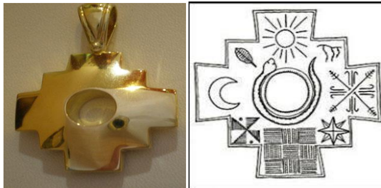
Cruz andina o Chakana

Nada de lo expresado era casual. “En el mundo andino, había un conocimiento profundo sobre la cosmogonía del universo, es decir, la explicación acerca de este; esa cosmovisión está también ligada a la cosmografía, que es la descripción del cosmos, en este caso correspondiente al cielo del hemisferio austral, cuyo eje visual y simbólico lo marca la constelación de la Cruz del Sur, denominada CHAKANA en la antigüedad, y cuyo nombre se aplica a la Cruz Escalonada Andina, símbolo del Ordenador o Viracocha.” 6