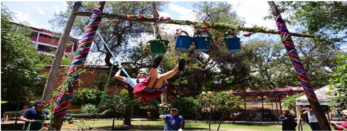
WALLUNKA DESPEDIDA DE LA FIESTA

En las distintas regiones es diferente la costumbre de despedida a los difuntos. En Cochabamba por ejemplo, se procede a la Wallunka, que es un armado de un columpio, tirado por personas, en donde su movimiento representa la relación del cielo y de la tierra, que implica un ceremonial muy particular, que significa amor y seducción.