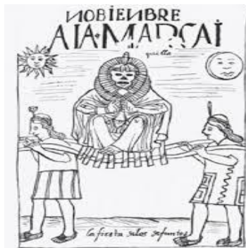
Fiesta de los difuntos. Ilustración: Felipe Guamán Poma de Ayala (1615)