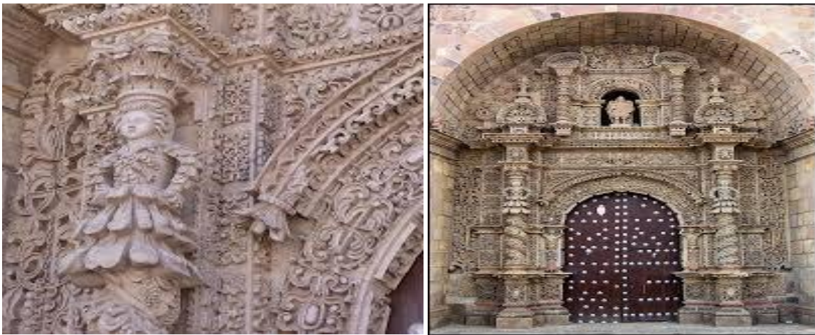
Indiatiles (cariátides) templo de San Lorenzo en Potosí. En mejor ejemplo del sincretismo religioso en Bolivia.

En el Nuevo Mundo, la tradición religiosa fue asimilada de unos a otros pueblos. Incluso en el Viejo Mundo, la fiesta de Todos los Santos o de los difuntos, no precisamente responde a los inicios de la iglesia católica. Fue más bien un acomodo que se hizo ante la necesidad de hacer conmemoración y reconocimiento de los hombres santos que dejaron huella en la iglesia. “En realidad, y aunque sea una forma muy poco correcta de decirlo, se trató de un “parche” del Vaticano para conseguir que todos los santos fueran venerados al menos un día al año. El impulsor de esta medida fue el papa Gregorio III, que durante su tiempo de pontificado (731-741) consagró una capilla en la Basílica de San Pedro en honor de todos los Santos, y fijó su aniversario para el 1 de noviembre.