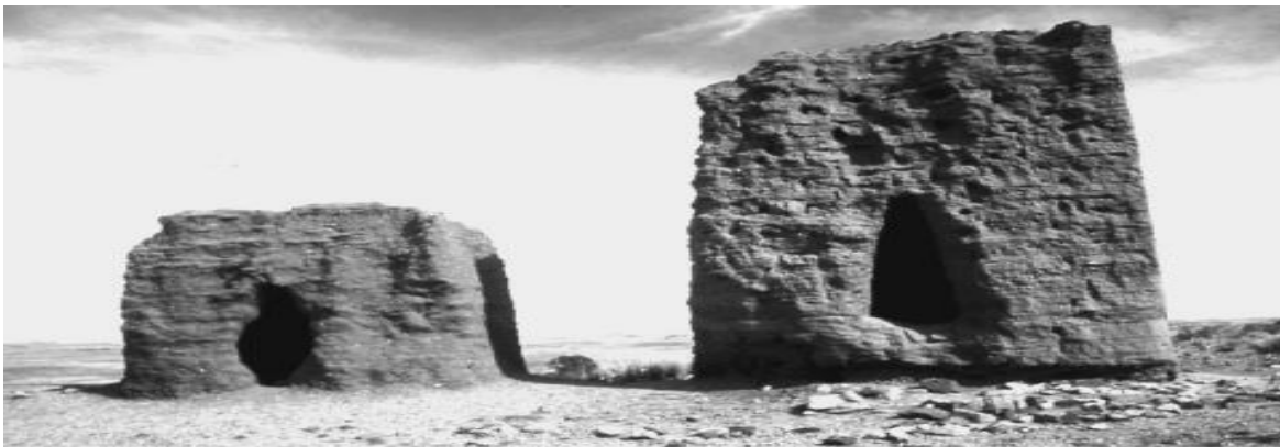
Dos chullpas. Espacios de enterramiento de las culturas ancestrales https://journals.openedition.org/bifea/4936

Al igual que las pirámides del Viejo Mundo, las chullpas, fueron monumentos funerarios de forma cónica, cilíndrica o cuadrada. Se ha registrado que, al margen de otras culturas, no de menos significación, se empezó a utilizar en la cultura Tiahuanaco, continuó con la aimara y luego con los incas. Se construía para conservar y proteger el cuerpo sin vida en la clase gobernante de sus pueblos.