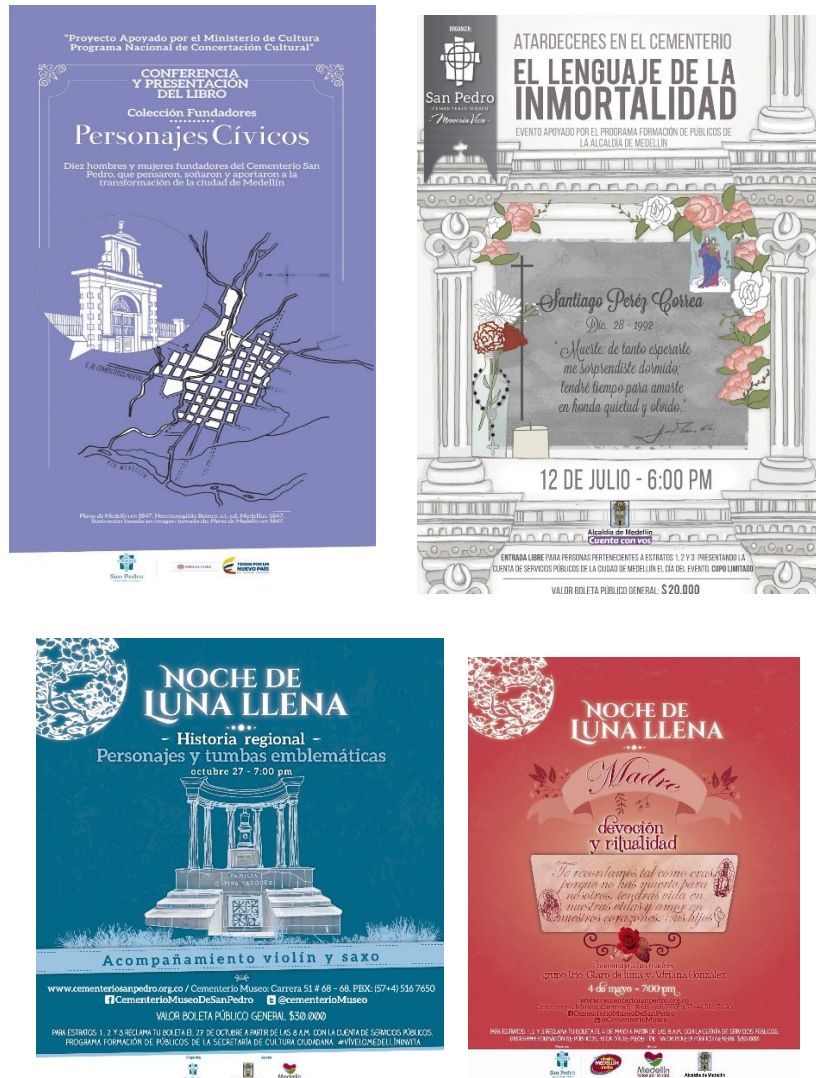
Imágenes 8 a la 11: Carteles de invitación para “atardeceres” y “noches de luna llena” en el Cementerio Museo San Pedro de Medellín

En cuanto a las “Noches de Luna Llena”, considero que con la aparición de los “Atardeces” ha ido virando su foco al enlace con el entorno cementerial hacia la representación artística dancística y musical. Lo cual no implica que el proceso de recorridos desaparezca como eje de ambas, simplemente varía la aproximación fenomenológica al espacio: el cementerio como escenario de “lo académico” frente al cementerio como escenario de “lo artístico”. Idea que podemos ver reflejada incluso en los carteles de invitación para los respectivos eventos (véase imágenes 8 a la 11).