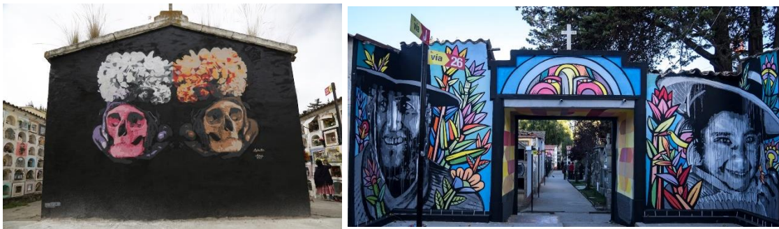
Imágenes 12 y 13: Murales en Cementerio de la Paz Bolivia

A continuación, quisiera mencionar uno de los más innovadores ejemplos de activación patrimonial a nivel de Latinoamérica: la profunda transformación que se dio en el cementerio central de Bolivia desde el año 2014 en adelante mediante el uso de un recurso de lúdica visual que apropia un ritual andino (la costumbre de decorar y llevar ofrendas a los cráneos de los familiares inhumados en los cementerios, cada 8 de noviembre, llamada “las ñatitas”) y lo plasma en las paredes mediante muralismo (véase imágenes 12 y 13).