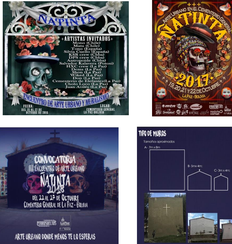
Imágenes 14 y 15: Afiches convocatoria a encuentros de arte urbano “ñatinta” 2016, 2017 y 2018, sumado a especificaciones técnicas para tipos de muros a ser intervenidos en convocatoria 2018

Para un total, a la fecha, de 75 murales realizados en las paredes del cementerio –un 37.5% de los 200 muros que contiene este cementerio-, 70 de ellos como resultado de tres convocatorias sucesivas entre el año 2016 y 2018 (véase imágenes 14 a la17).