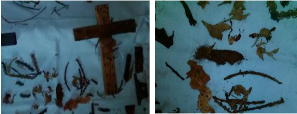
Fotografía 28 y 29. Restos del ajuar funerario.

En este caso los elementos localizados sugieren que los individuos fueron vestidos posiblemente como algún santo para su entierro, ya que las flores son parecidas a las que lleva San José, sin embargo, los restos de tela localizadas para los tres individuos son de color rojo, como las que lleva el niño de Praga o el Sagrado Corazón de Jesús (Fotografía 28, 29, 30 y 31).