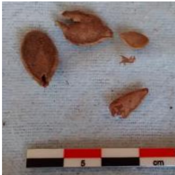
Fotografía 27. Restos de semilla de calabaza.

Los tres individuos presentaban restos de materiales, utilizados seguramente para su ajuar funerario, entre los que destaca restos de tela de color rojo, flores, diademas y cruces; así como semillas de calabaza, lo cual nos puede indicar que los sujetos se encontraban vestidos al momento de ser enterrados, además de que se le colocó alimento costumbre que aún prevalece en algunas comunidades de nuestro país. (Fotografía 27).