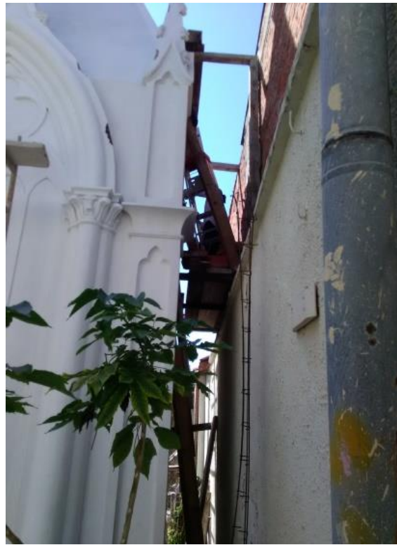
Fotografía 5. Ubicación de la gaveta (parte posterior).