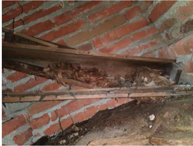
Fotografía 7. Restos de ataúd.

Al retirar los tabiques de la entrada, inmediatamente se observan los restos de un ataúd completamente destruido al interior de una gaveta de 95 x 94 cm, tal como se aprecia en la siguiente imagen. (Fotografía 7).