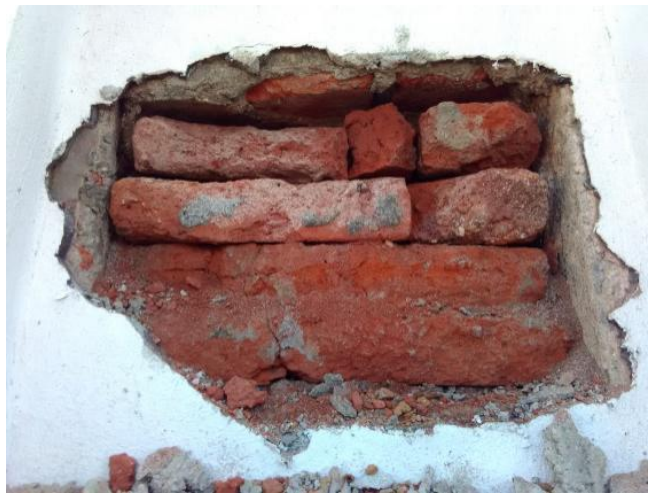
Fotografía 6. Entrada de la gaveta: