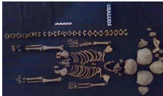
Fotografía 17. Individuo 1.

De acuerdo al análisis antropofísico se sabe que se trata de un individuo de un año de edad en buen estado de conservación que presenta afecciones de la salud asociadas con procesos anémicos, tales como cribra orbitalia en el techo de las orbitas (Fotografía 17). Como material asociado se observaron restos de flores, tela de color rojo, restos de una diadema, así como una cruz de madera, elementos usados seguramente durante el ritual funerario.