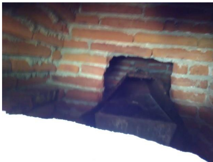
Fotografía31. Identificación de otros ataúdes de individuos seguramente adultos.