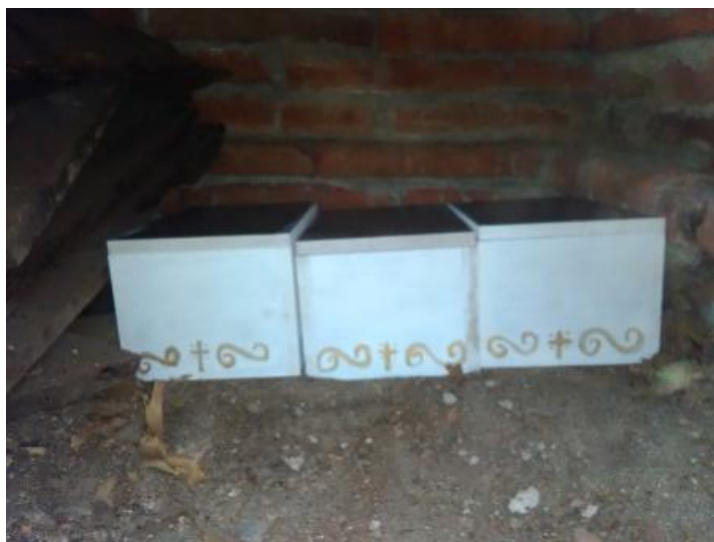
Fotografía 26. Individuos depositados en la gaveta después del proceso de conservación y análisis.