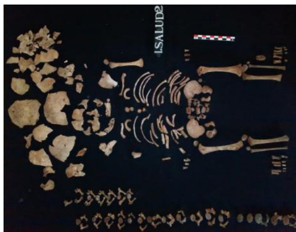
Fotografía 18. Individuo 2.