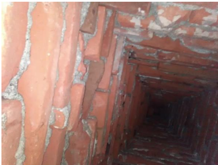
Fotografía 8. Terminación en triángulo hacia la parte superior de la bóveda.

Dicha gaveta presenta una terminación en triángulo hacia la parte superior de la oquedad (Fotografía 8).