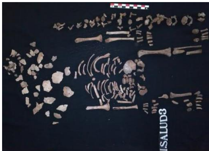
Fotografía 19. Individuo 3.

Individuo 3: Se trata de un entierro colectivo, secundario, indirecto, recién nacido, al cual le fue depositado algún tipo de material calcáreo que afectó a los restos óseos y les dio cierta coloración blanquecina (Fotografía 19) como material asociado presentó restos de flores artificiales, de tela en color rojo, de una diadema con las cuales fue vestido para su ritual funerario.