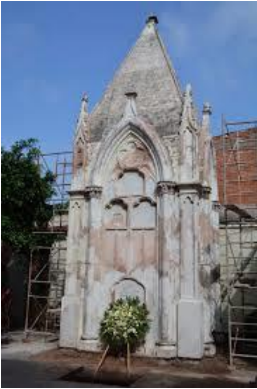
Fotografía 4. Parte Frontal del monumento