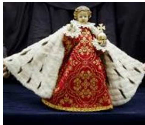
Fotografía 30 y 31 Imagen de San José y el Niño de Praga.