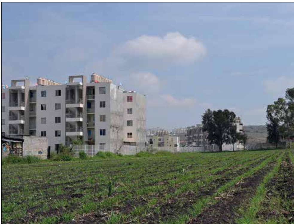
Parcela con cultivo de sorgo al lado de edificios con cinco niveles de departamentos del fraccionamiento Villas de Oriente. Archivo (junio de 2017).

a mediados de la década de los setenta del siglo pasado y, aunque el marco institucional que regulaba la propiedad social durante esa etapa lo prohibía, en realidad nunca fue una barrera para evitar que la tierra ejidal se privatizara. Sin embargo, cabe señalar que la dinámica de la transformación del ejido periurbano estudiado, ocasionada por la expansión de la ciudad en esa época, es lenta, y predomina como forma de urbanización la colonia popular irregular.