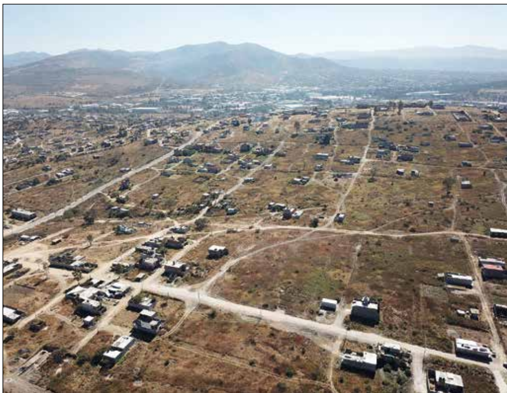
Zona sur del ejido La Aldea. La imagen corresponde a la primera colonia, llamada Buenos Aires, asentada sobre lo que fue parte de la zona parcelada del ejido.