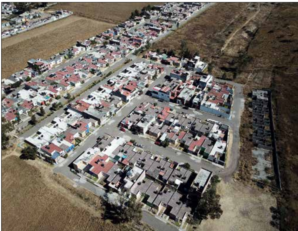
Primera etapa de la Nueva Aldea. (Laboratorio universitario de drones, UNAM, noviembre de 2017).

plazamientos para ir a su trabajo; caminar por calles en mal estado, muchas de ellas sin pavimentar e inseguras; enfrentar dificultades para acceder al agua y llevar a sus hijos a escuelas con altos niveles de precariedad. Esto es evidencia clara de las implicaciones nocivas —ecológicas y sociales— que trae consigo la urbanización neoliberal, que es guiada principalmente por la lógica de la acumulación de capital.