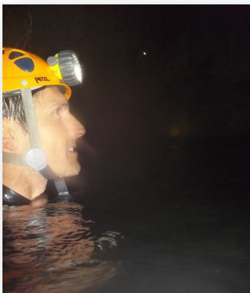
Emilio Felices en Hundidero-Gato

Un lugar increíble. Amplio, largo, a la vez frío por las gélidas aguas de las que dudas si permanecer en ellas por la belleza