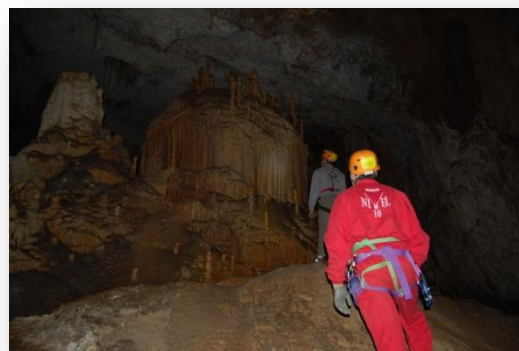
El Castillo de Sima Begoña

Aquí quiero agradecer a un compañero autóctono de la zona que nos la mostró al detalle. Sin él no hubiera sido lo mismo.