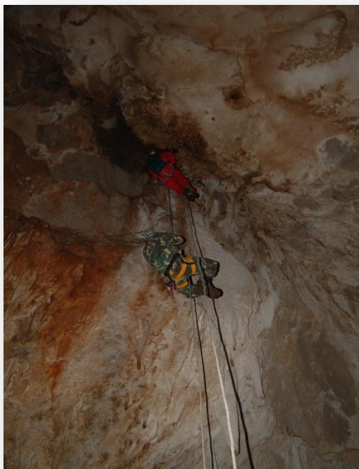
Ascendiendo el pozo de Sima Begoña

Buaagg! Esta sin duda no puedes dejar de verla. Desde el momento que entras no para de asombrarte, bella y delicada. Es deseo de todos ir de puntillas, guardando el equilibrio y esperando no tener el mínimo descuido.