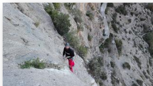
Plácido en los primeros metros de vía.

La garganta también es conocida por los lugareños como Garganta del Dragón o Garganta de Escalate, si bien es popularmente conocida por todos como Tajo de los Vados. Esta garganta está conformada por varios tajos, siendo los más importantes el Tajo de la Virgen (existe una leyenda de la zona que habla sobre la existencia de una virgen en un pequeño recoveco a gran altura de este tajo), y el Tajo del Canal, siendo en este último donde se encuentra la vía ferrata.