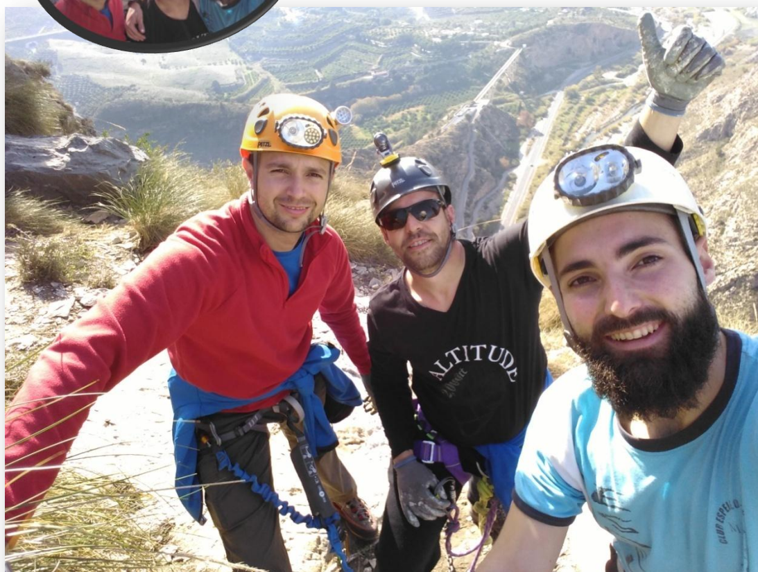
¡Via Terminada!