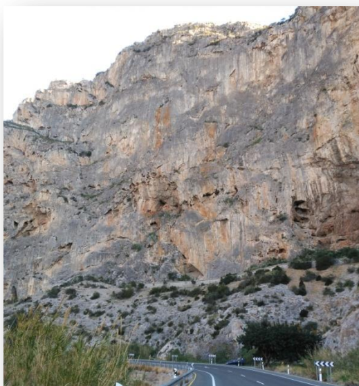
Vista del tajo del Canal

En esta ocasión nos vamos hasta la cercana sierra de Escalate, donde realizaremos la vía ferrata del Tajo del Canal, también conocida como vía ferrata del Tajo de los Vados.