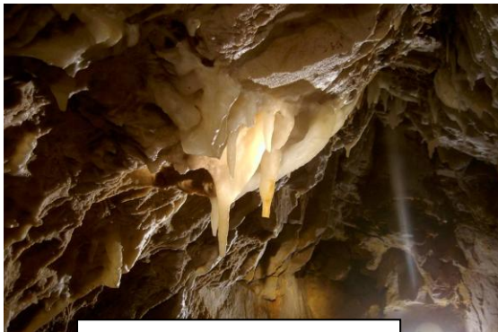
Estalactitas de Cueva Blanca

El Club, viendo que las actuaciones pretenden continuar, pone en conocimiento de la Guardia Civil todo este asunto, concretamente al Seprona.