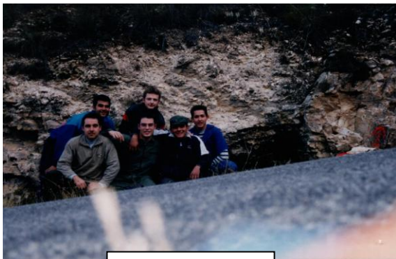
Cueva Blanca 2000

A continuación se pone en conocimiento de la FAE para dar un impulso más a la paralización de las obras en dicho tramo. Ya han pasado 15 días y las obras