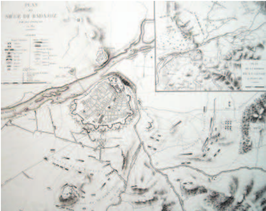
Lallemand - Plan du Siège de Badajoz. 4 Gatos.

¿Y del asedio británico de 1812 que acabó con la toma de la ciudad por parte británica? Pues lógicamente la mayoría de los mapas y planos existentes son británicos y españoles. Por tanto, podemos concluir que tan valioso es para el autor o editor del plano la simple transmisión de un hecho informativo, en nuestro caso el desarrollo de un asedio, como crear un estado de opinión favorable, mostrar el poderío militar propio o levantar la moral de su población mostrando las victorias del propio bando y silenciando las derrotas.