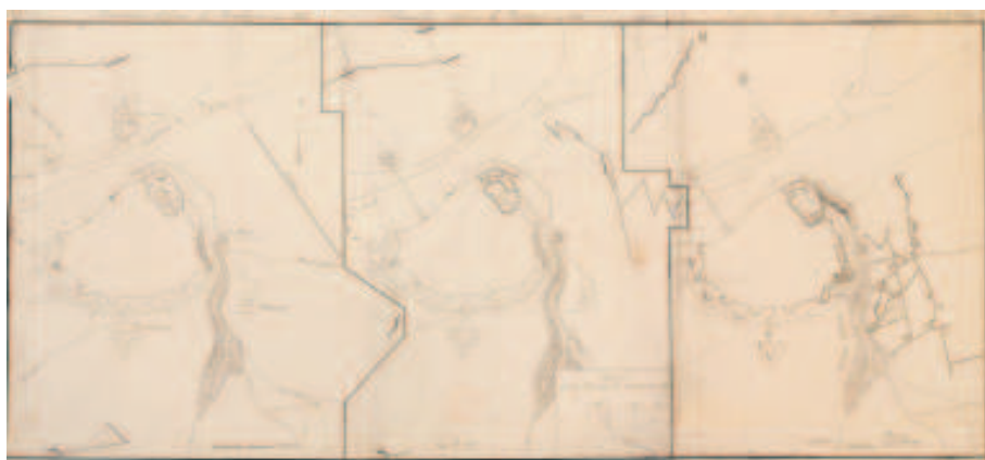
Baclesse - Défense de Badajoz. 4 Gatos.

Tan pronto como Badajoz fue ocupada por las tropas francesas, toda la plaza se puso bajo el mando del general Armand Philippon, mientras que el coronel Lamare asumió la dirección de las fortificaciones. Las tropas imperiales encontraron una Badajoz bien surtida de municiones y armamento de diversos calibres, hasta las 170 piezas artilleras.