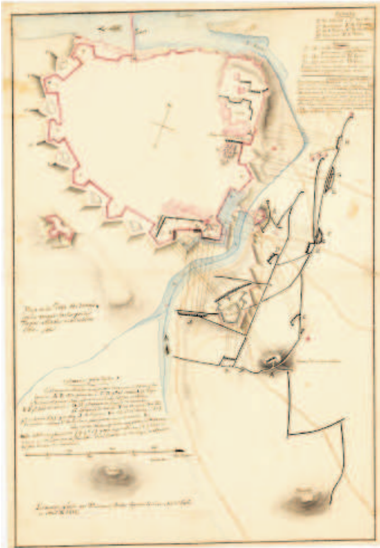
Fondós - Plan de la plaza de Badajoz. CGE.

posibilidad de clemencia en caso de ser derrotados. Se trataba de una forma de economizar recursos, principalmente humanos, por ambos bandos y de ofrecer una salida digna a los defensores, de acuerdo con la concepción del honor militar imperante en la época. Los historiadores franceses atribuyen esta postura de Wellington al orgullo herido por los asedios fallidos del año anterior.