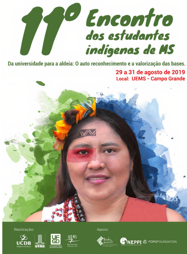
Imagem 01 - Cartaz do 11º Encontro de Estudantes Indígenas do MS.