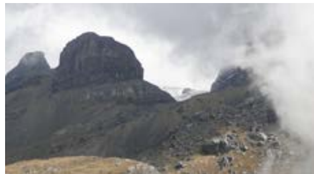
Figura 11. Al fondo las orillas actuales del nevado Ampay