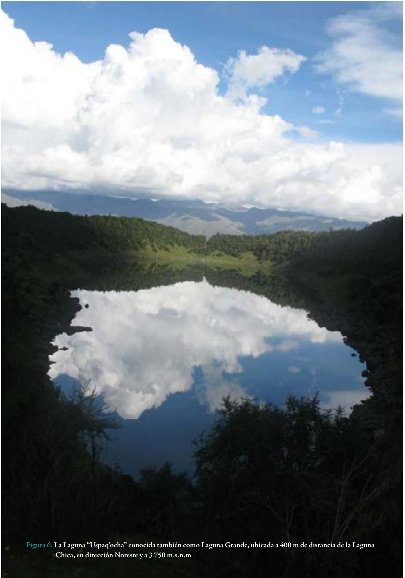
Figura 6. La Laguna "Uspaq'ocha" conocida también como Laguna Grande, ubicada a 400 m de distancia de la Laguna Chica, en dirección Noreste y a 3 750 m.s.n.m