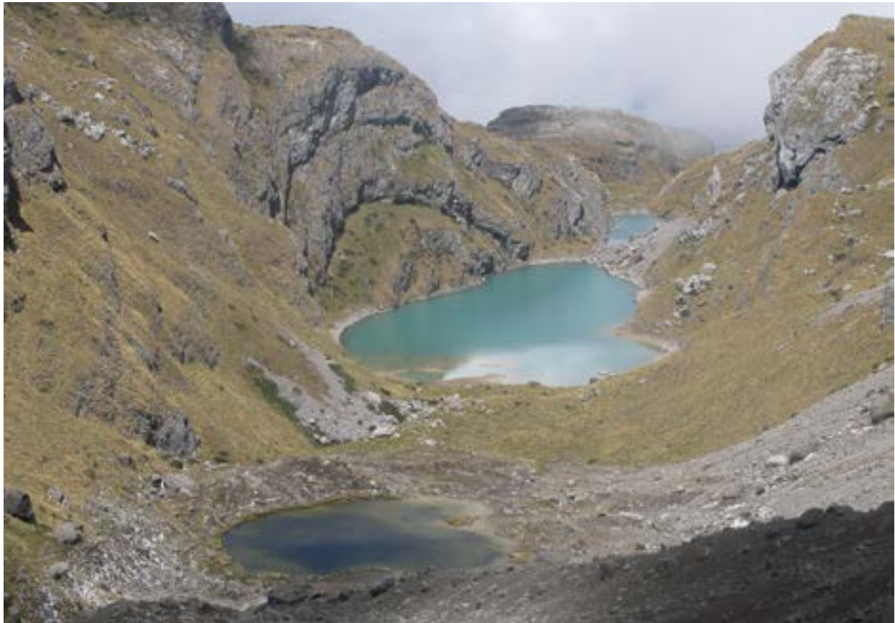
Figura 3. Lagunas ubicadas por encima de los 4 000 metros de altitud, modeladas sobre rocas sedimentarias, como producto del retroceso glaciar

Meteorología: SENAMHI, IDMA Climatología: SENAMHI, INRENA Botánica: INRENA, IDMA Zoología: INRENA, IDMA Ecología: INRENA Riesgos: INDECI