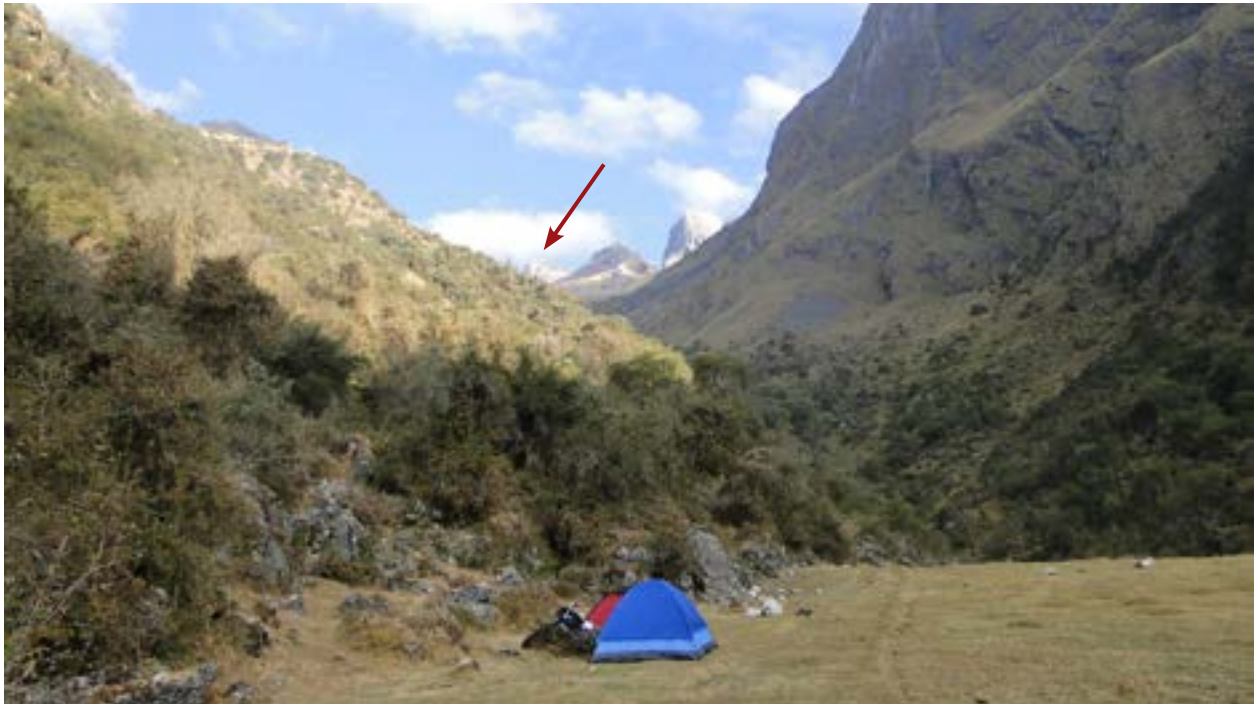
Figura 2. Campamento hasta donde en el año 1997 se extendía la superficie glaciar. Al fondo el Ampay

nan rocas sedimentarias de origen marino, cuyo origen geológico se inició en la era Cenozoica, aproximadamente hace más de 65 millones de años, remontándose a los inicios de la formación de la cordillera de los Andes. Las unidades litoestratigráficas más representativas en esta zona asociadas a la cordillera de Vilcabamba son: