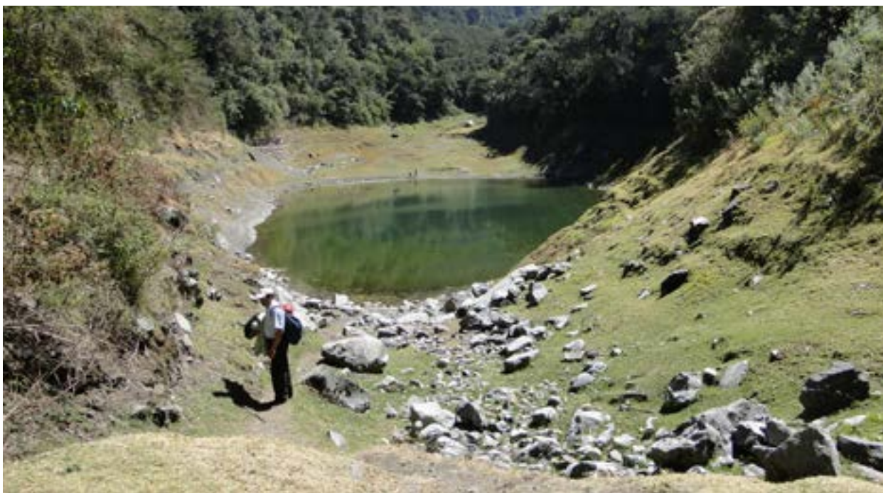
Figura 4: Laguna de “Ankasq’ocha” (3 200 m.s.n.m.), se encuentra en proceso de eutroficación en suelos con horizontes edáficos de escaso desarrollo y dominados por una fuerte pendiente, se clasifican como tierras de protección, deben destinarse al uso como bosques de protección