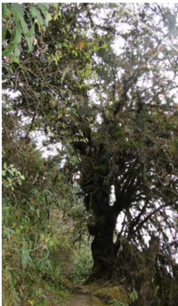
Figura 7. Intimpa ( Podocarpus glomeratus ) silvestre