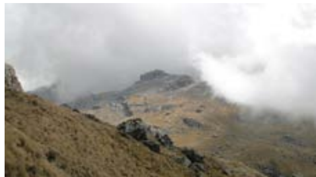
Figura 10. Retroceso de la superficie glaciar, obsérvese la morrenas