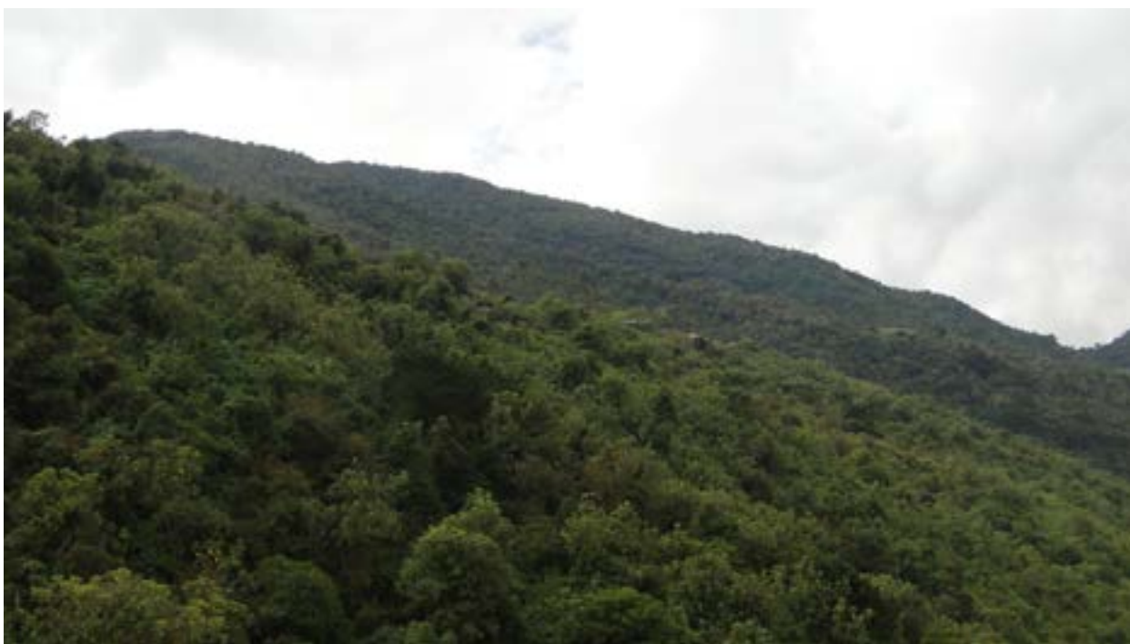
Figura 5. El bosque no solo cumple la función de ser sumidero de anhídrido carbónico, es también un almacén del recurso hídrico. El 60% de las lluvias quedan retenidas en estas zonas