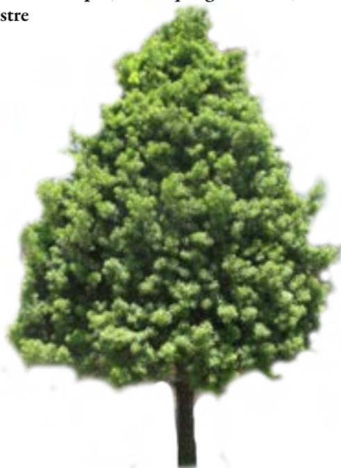
Figura 8. Intimpa ( Podocarpus glomeratus ) cultivada

No existen estudios hidrogeológicos, por lo tanto, es imposible determinar la reserva del acuífero subterráneo, pese a que existen numerosos manantes o puquiales de origen kárstico.