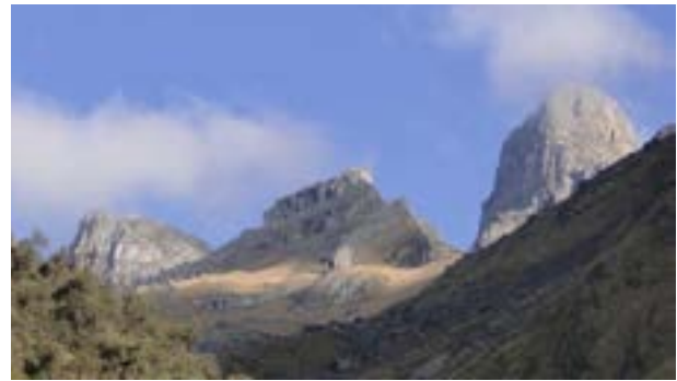
Figura 9. Cumbres que estuvieron cubiertas de nieve

Uno de los proyectos alternativos que permitiría mitigar los efectos sociales de la desglaciación