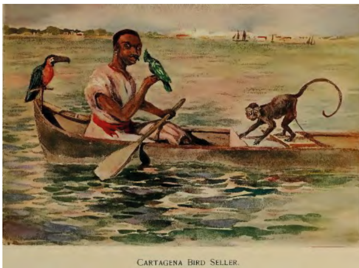
Ilustración 2. Vendedor de pájaros

esclavo, porque lo asemejan a su condición de cautivo, y a su vez, su condición de servidumbre (esto en relación con los papagayos). El otro nivel que se puede analizar son las continuas referencias a los animales considerados como salvajes, tales como el simio o el caimán (ver imagen 3); esto, porque se consideraba que los sujetos negros estaban en capacidad de relacionarse con ellos fácilmente.