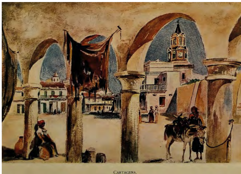
Ilustración 1. Plaza del reloj Cartagena de Indias

Blaney, Henry R. The Golden Caribbean: A Winter Visit to the Republics of Colombia, Costa Rica, Spanish Honduras, Belize and the Spanish Main . (Boston: Lee and Shepard, 1900). Public domain. Cortesía Hathi Trust Digital Library https://catalog.hathitrust.org/Record/009598842