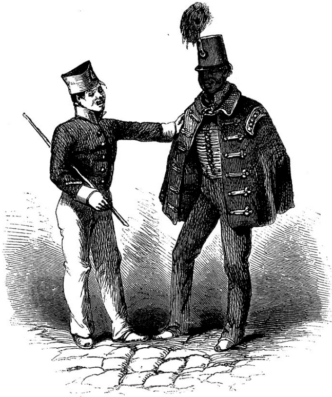
FOOT-SOLDIER AND LANCER.