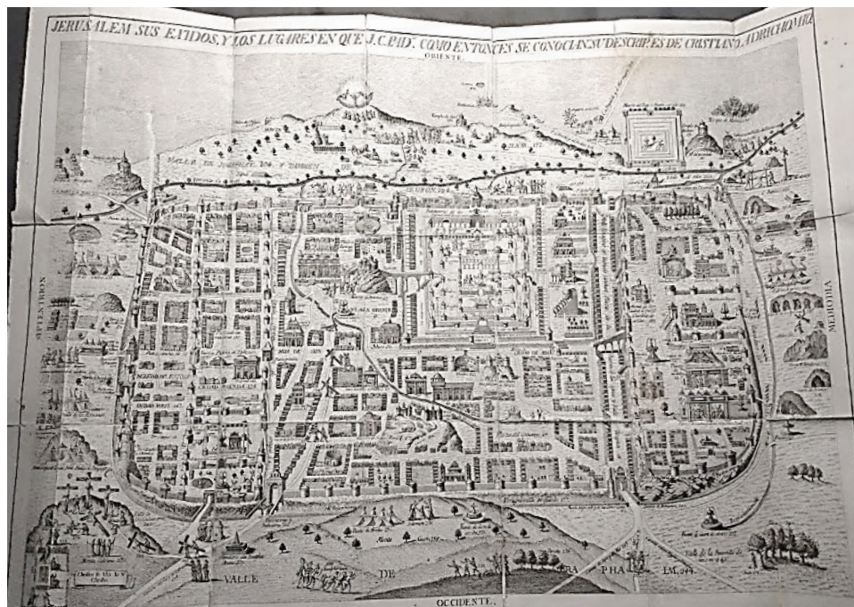
Delfo y Guerrero (1799): mapa del bifolio inserto y plegado

Pero volvamos a la misma portada de este libro; en ella se incluye también la justificación de la inclusión de la obra de Guerrero: «va agregado al fin el viaje de Jerusalem que hizo y escribió Francisco Guerrero, para que se vea la diferencia que hay en esta Ciudad de aquel tiempo al de ahora». El relato de Guerrero se había convertido en un icono y hasta la propia experiencia viajera comparada ofrecía un ingrediente adicional que lo hacía aún más atractivo para el peregrino: se trata de «que se vea la diferencia». Lo sugerente es que el viaje de Adricomio Delfo había sido propiamente contemporáneo del de Guerrero: sin embargo, para los siglos siguientes uno aporta el testimonio escrito de su experiencia (el relato de peregrinación) y otro las referencias técnicas y gráficas de los lugares visitables (la guía de viaje). Sea como fuere, Guerrero se hace tradición en los siglos siguientes.