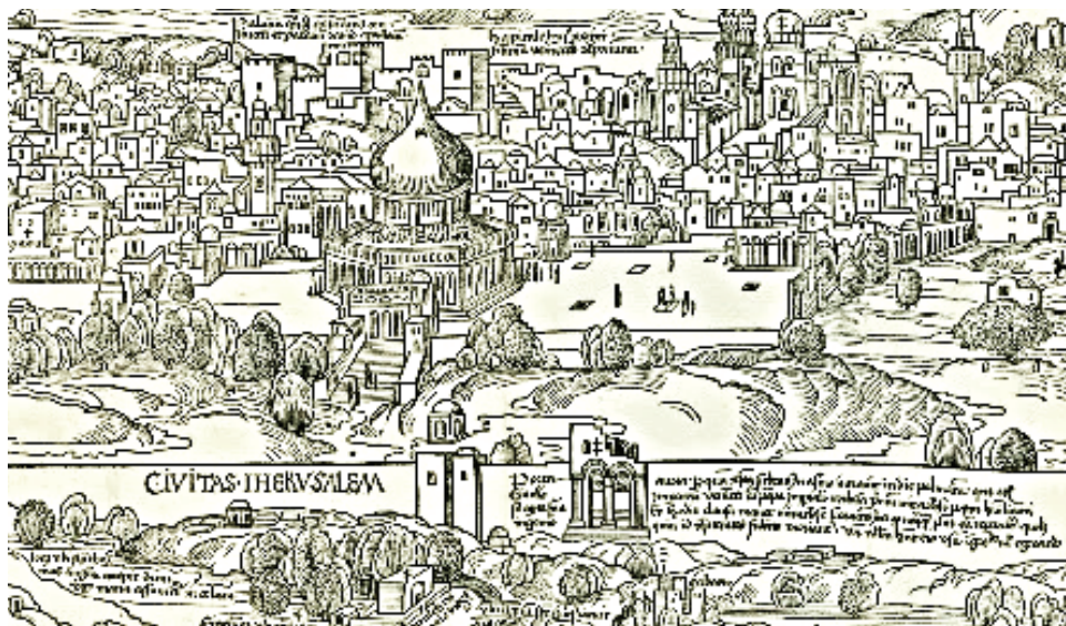
Mapa de Jerusalén (Reuwich), detalle

Debe notarse, de nuevo, esa sugestiva primera persona que da a su viaje un tono confesional, como de testimonio, algo relativamente novedoso en la tradición de los relatos de peregrinación. Retengamos que el siglo XVI es el de la primera persona narrativa, la que leemos en el Lazarillo y entrevemos en las ironías cervantinas o en el romancero nuevo de Lope de Vega. Es claro que los escritores mayores del Siglo de Oro habían leído libros de pastores y de caballerías, literatura religiosa, crónicas, libros historiográficos... A la vista del extraordinario éxito de obras como la de Guerrero, parece evidente que se trata de un formato narrativo y autobiográfico que debían de conocer también esos grandes autores del Siglo de Oro.