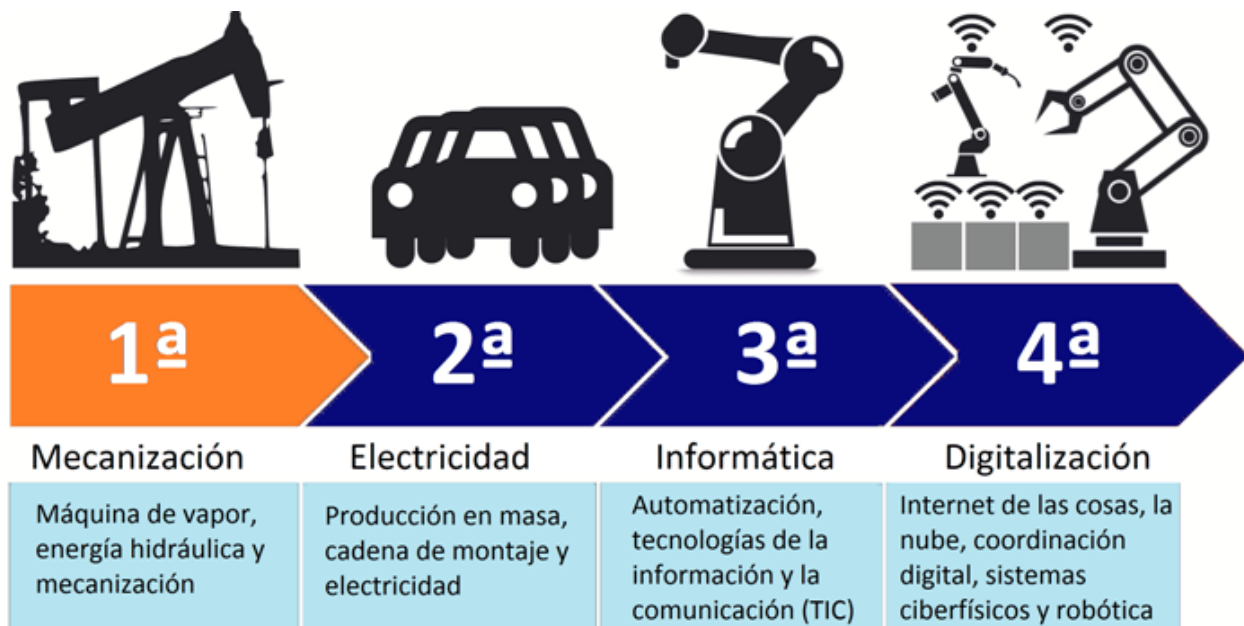
Figura 3. Revolución industrial.

Por otro lado, (Llanes-Font, et al. 2020) indican que uno de los principales retos, es la aplicación transversal en la administración pública de las herramientas digitales con la finalidad de permear las políticas a aplicar en beneficio de instaurar efectivamente la era 4.0 en el escenario latinoamericano y caribeño, lo cual no debe confundirse con la revolución 3.0 basada en la informática, para lo cual, se brinda la siguiente infografía (ver figura 3):