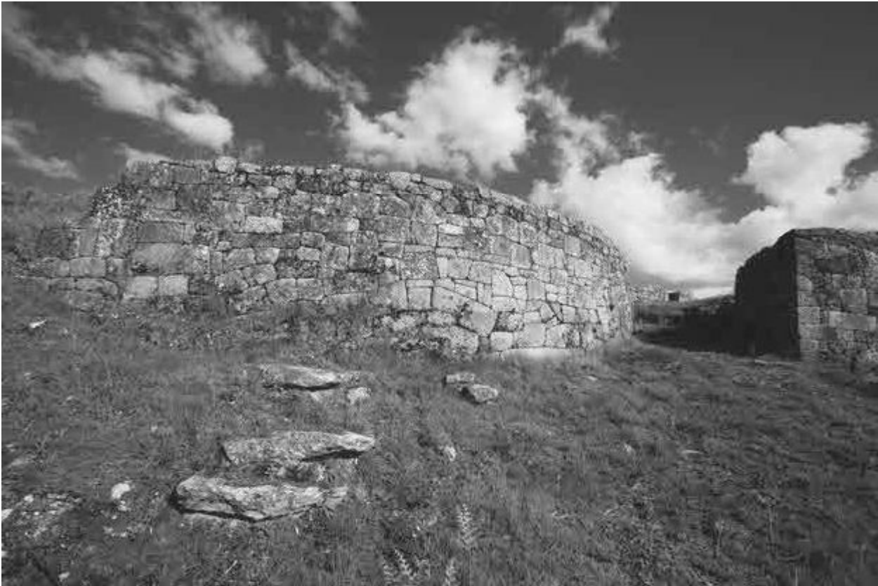
Porta Norte de acceso ao recinto inferior do Castro da Saceda.

A muralla deste segundo recinto, reconhecida como muralla ciclópea malia a contar con engadidos posteriores, recibe tal nome pola tipoloxía construtiva da súa porta de acceso con dous monolitos de grande tamaño en posición vertical. Acceso moi próximo ao punto onde se anexaría a muralla na que foi localizada unha poterna oculta.