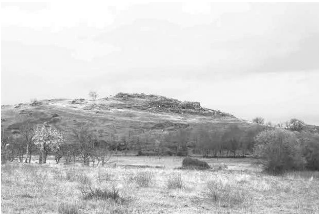
Vista do poboado fortificado dende a aldea de Saceda

Dende o ano 2015 e ata o 2020 é a quenda do noso traballo no xacemento arqueolóxico. Unha actividade concentrada primeiro na análise da cultura material depositada no Museo Arqueolóxico Provincial de Ourense, aquela recuperada entre os anos 1982 e 1988. E segundo practicando diferentes intervencións arqueolóxicas e de restauración que permitan avanzar na investigación e ao tempo acondicionar o monumento para a súa visita e difusión a tódolos públicos.