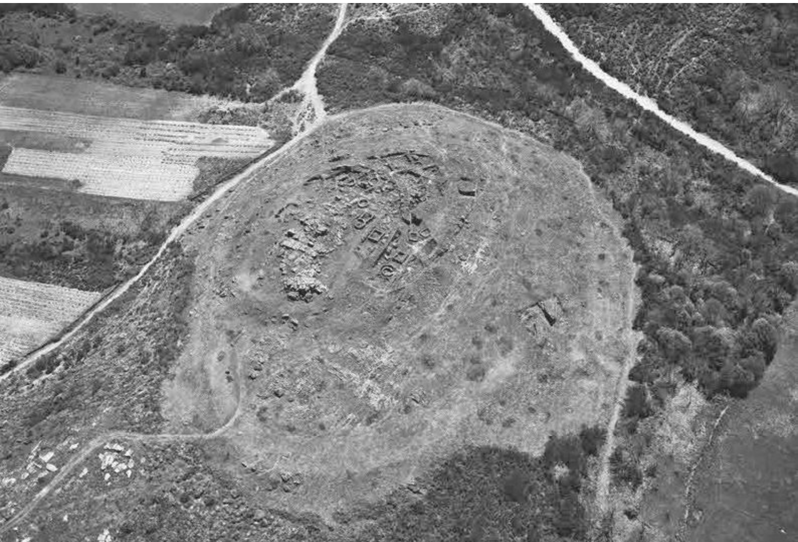
Fotografía aérea do Castro da Saceda Autor: Mani Moretón