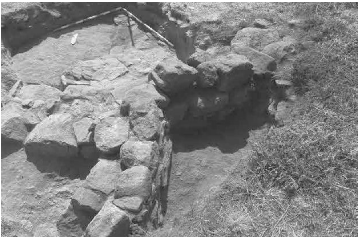
Cabana descuberta por nós na campaña de intervención arqueolóxica de 2018 fóra do poboado fortificado