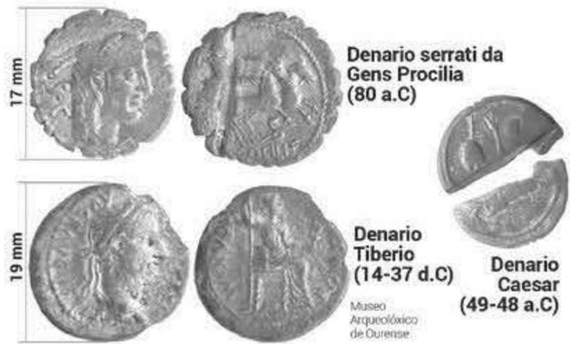
Numismas e cronoloxías asociadas recuperadas no Castro da Saceda

Sería no recinto inferior, dentro dunha camada de terra moi areosa derivada do escorregadoiro do terreo, polo tanto nun nivel de arrastre, onde apareceron algúns dos materiais máis antigos e singulares do xacemento. Obxectos que aportan unha cronoloxía desigual e que deixan aberta a ocupación deste emprazamento dende o Calcolítico ata a Romanización (Vázquez Mato, 2015A).