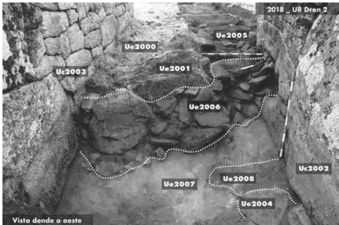
Síntese interpretativa sobre fotografía da escavación arqueolóxica practicada por nós na Porta Cicolópea do Castro de Saceda.