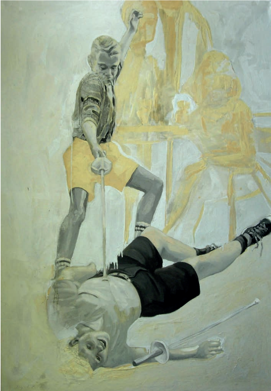
Título: «Romo #1». De la serie Las cualidades del blanco ; técnica: óleo sobre tela, año de ejecución: 2003; dimensiones: 200 cm x 140 cm.