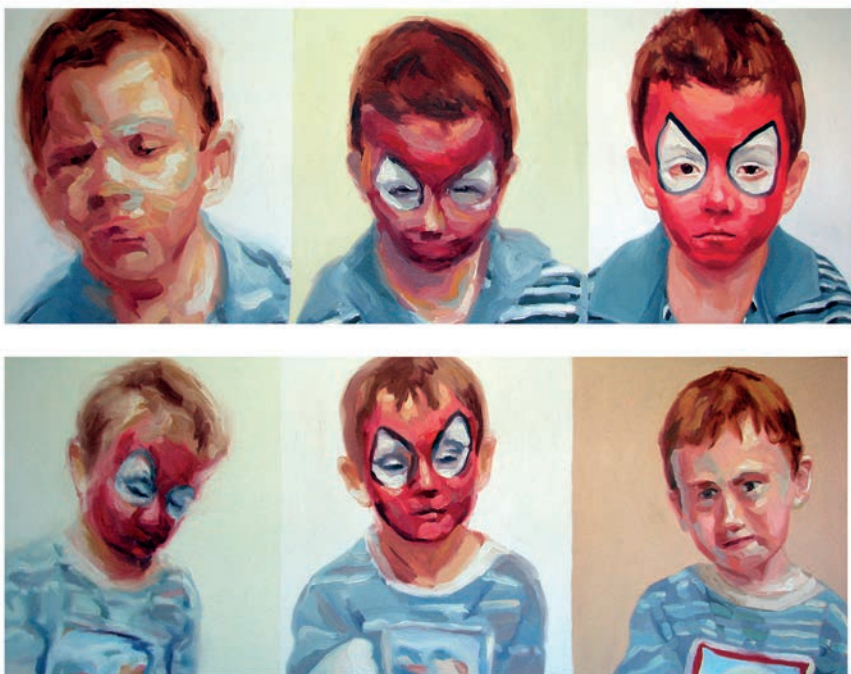
Título: «Transformaciones #2». De la serie Súper héroes ; técnica: óleo sobre tela; año de ejecución: 2006; dimensiones: 143 cm x 194 cm, díptico.