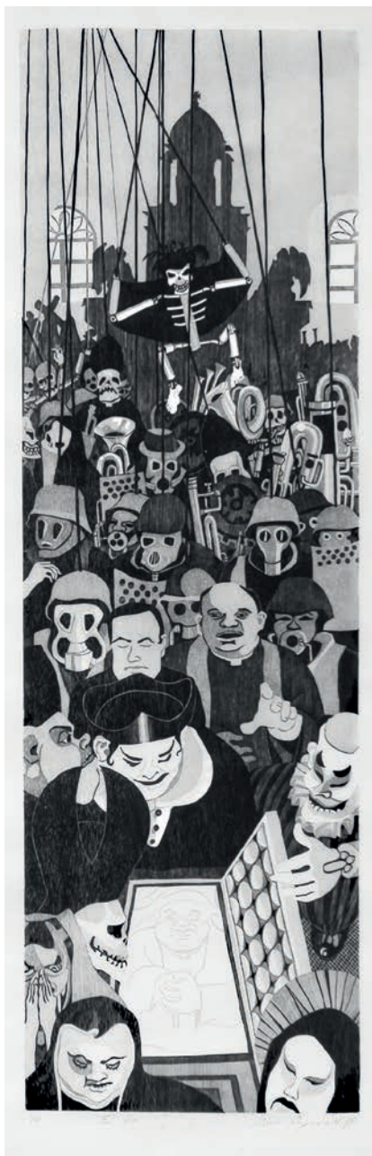
Título: El fin ; técnica: xilografía; año de ejecución: 1990; dimensiones: 144 cm x 45 cm; edición: 9 ejemplares