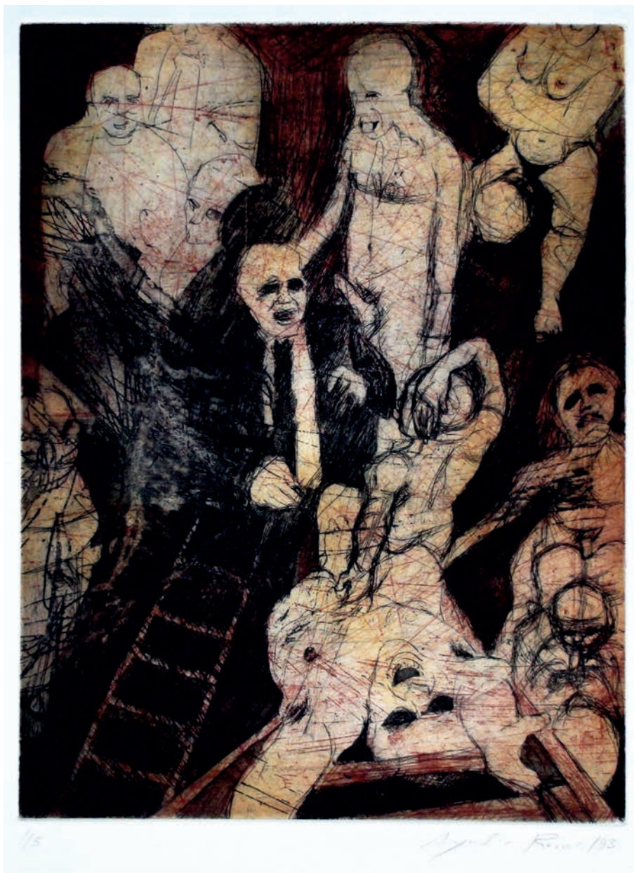
Título: «Escalera #4». De la serie Conjunto sexual ; técnica: punta seca; año de ejecución: 1993; dimensiones: 38 cm x 29 cm.; edición: 5 ejemplares.