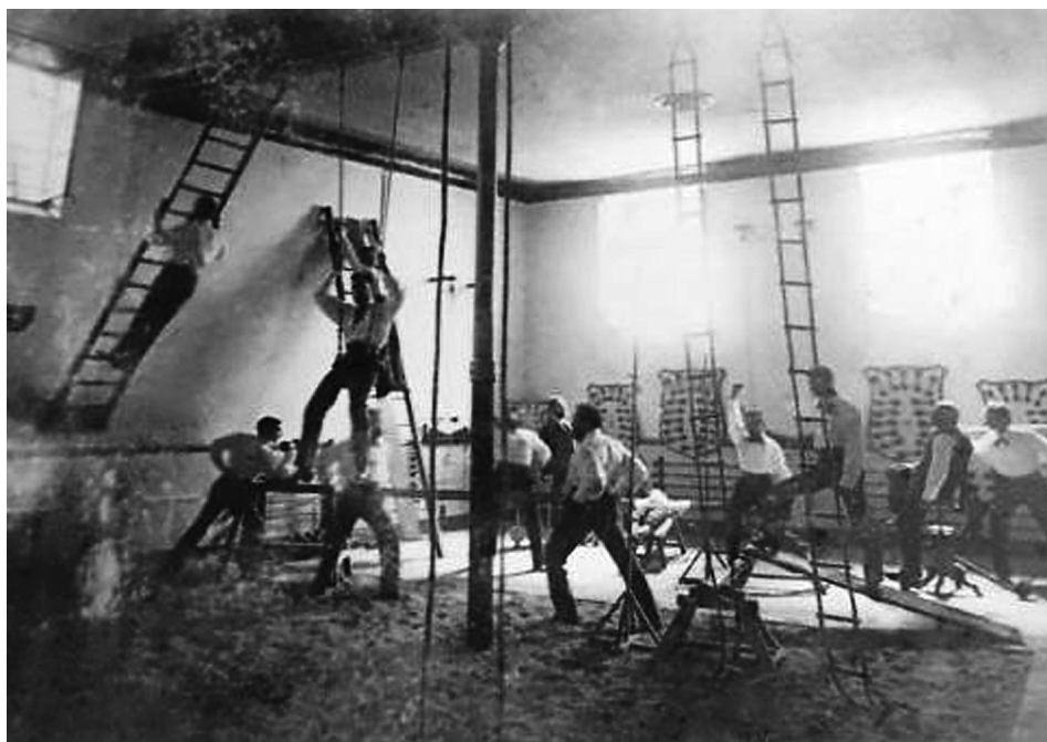
Fig. 2 Gimnàs higienista mèdic a Palma, de finals del segle XIX. De gimnasos com aquest sortiren els primers palmesans que practicaren futbol a Palma.