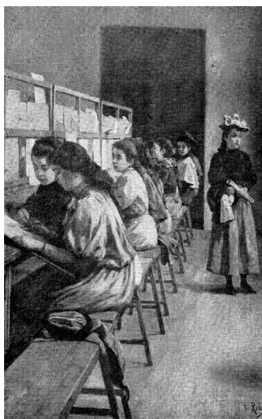
Fig. 2 Clase de dibujo (1896), d'Antoni Ribas. Reproducció de l'obra extreta de: RIPOLL, L.; COSTA, J.: Antonio Ribas , Palma, 1948, s. n.