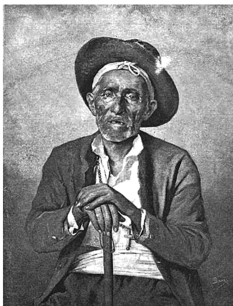
Fig. 1 Estudio del natural (1891), de Joan Bauzá.