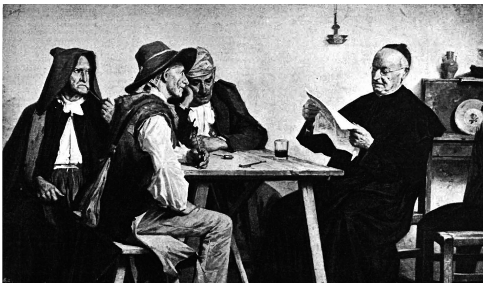
Fig. 3 Noticias de Cuba (1896), de Joan Bauzá.