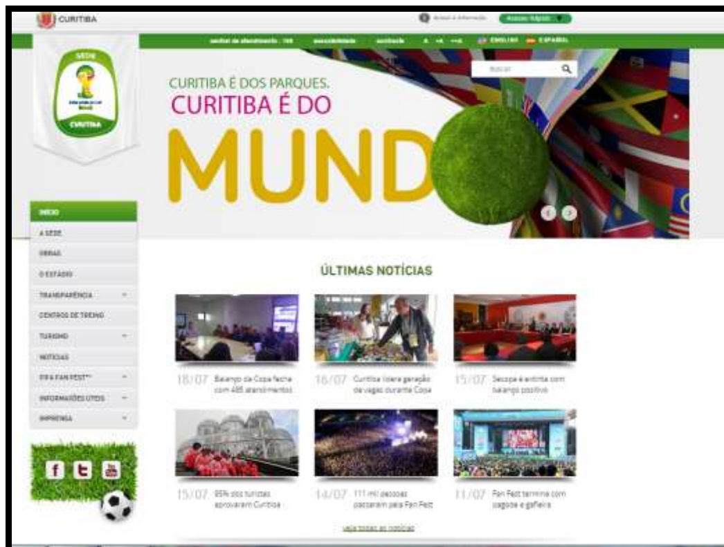
Figura 6 – Página inicial do site de Curitiba (Parte superior)