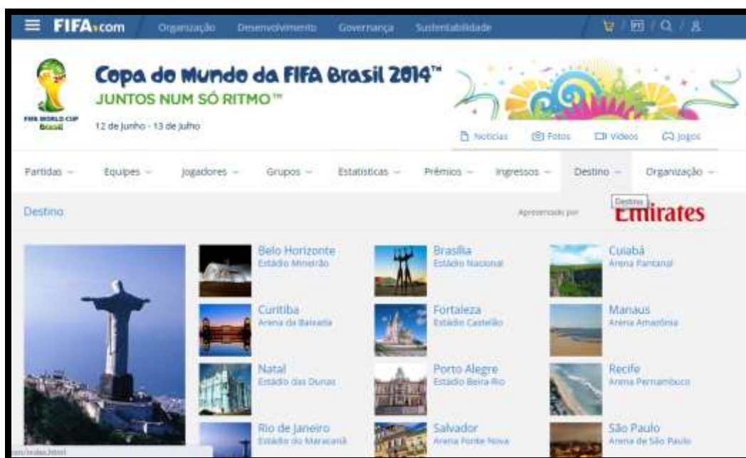
Figura 1 – Página inicial das cidades sede

O website descrevia Curitiba como um exemplo perfeito de que uma cidade pode se desenvolver e crescer economicamente de forma organizada e responsável e salientava que após virar capital do Paraná a cidade passou por vários projetos de planejamento urbano para evitar o crescimento descontrolado se apresentando como o berçário de planos alternativos para problemas que afligem diversas cidades no planeta, como o transporte público e a proteção do meio ambiente. A página descrevia a cidade como preocupada em preservar o verde nas áreas urbanas usando como exemplo os Parques Tanguá, Barigüi e o Jardim Botânico da cidade descrevendo-o como belo, além de citar a Ópera de Arame como impressionante estrutura de aço e vidro e o museu Oscar Niemeyer, projetado pelo próprio arquiteto.