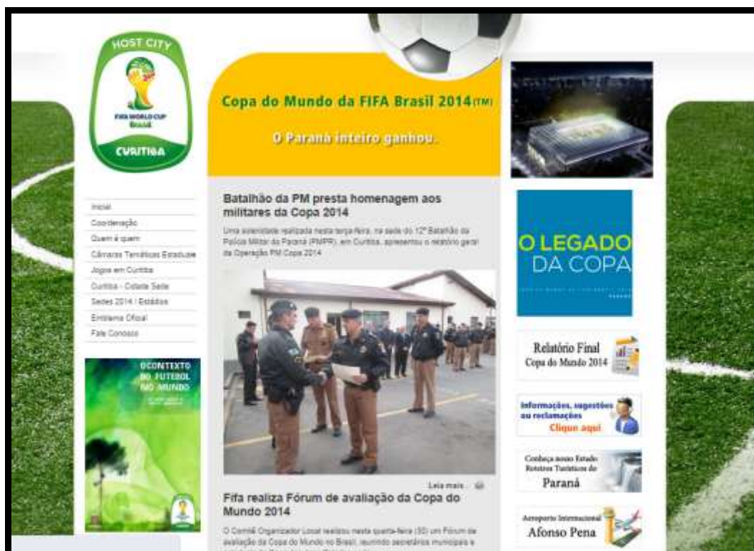
Figura 5 – Página inicial do site do Governo do Paraná na copa