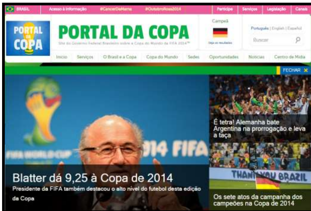
Figura 3 – Pagina inicial do Portal da Copa

Este website apresentava informações sobre todas as sedes da Copa do Mundo FIFA 2014, para obter informações sobre Curitiba era necessário acessar o website e na página inicial (Figura 3) clicar na guia Sedes onde estava disponível um link para acessar as informações da cidade sede escolhida. Após clicar no link Curitiba abria uma nova página (Figura 4) aonde era possível identificar seis guias na vertical do lado inferior esquerdo do website sendo elas respectivamente: A cidade , Arena da Baixada , Aeroporto , Mobilidade urbana , Os Jogos em Curitiba e Patrimônio Cultural . A coleta de dados e posterior análise foram baseadas nestas guias citadas.