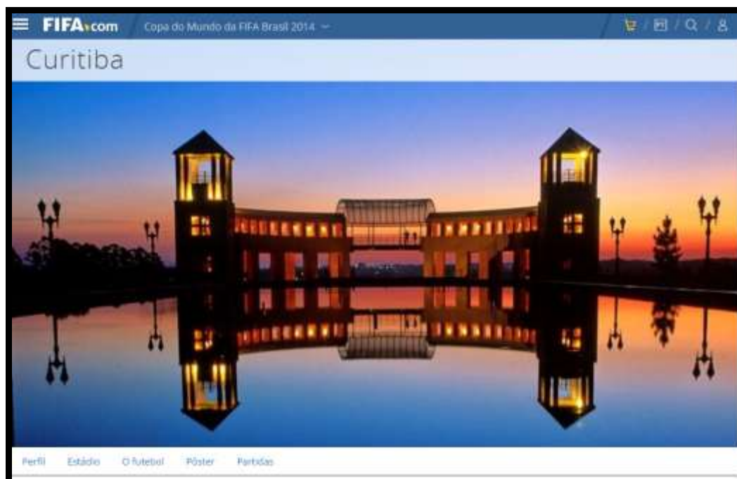
Figura 2 – Pagina principal de Curitiba cidade sede