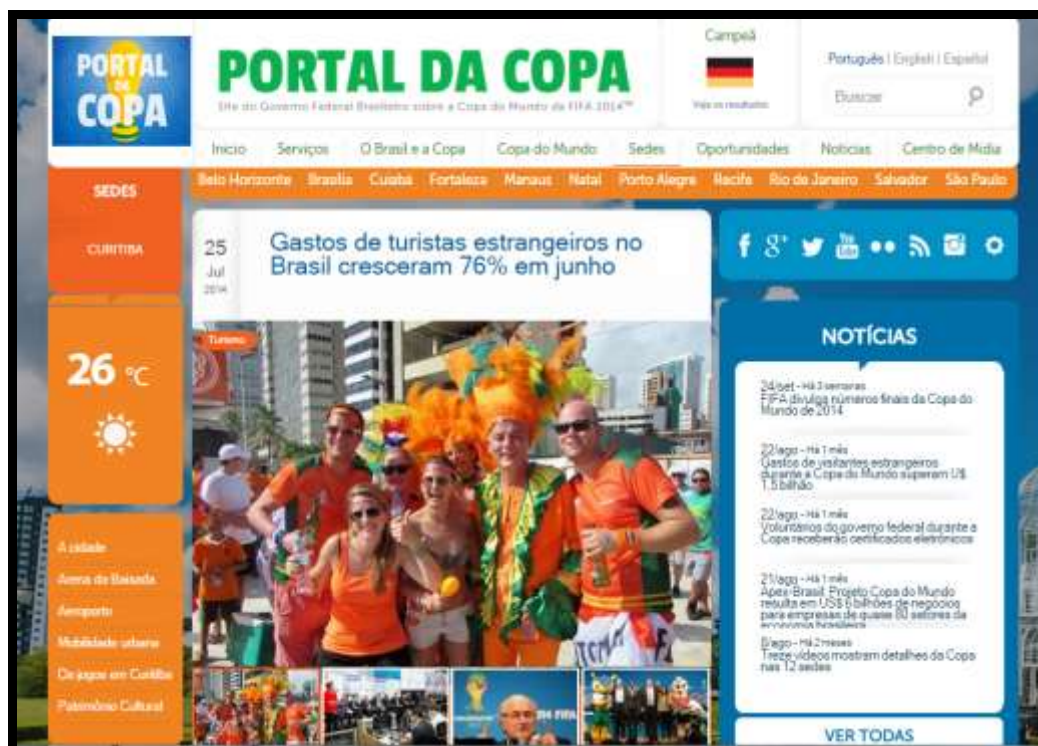
Figura 4 – Pagina inicial de Curitiba cidade sede no Portal