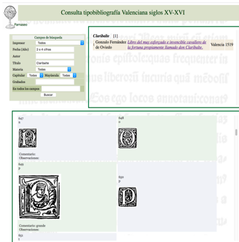
Capitales del Claribalte de Gonzalo Fernández de Oviedo (Valencia, Juan Viñao, 1519)

todo, incluye un sistema de búsqueda general, capaz de localizar cualquier palabra del título o de su descripción (autorías de preliminares, coautorías, dedicatorias, etc.).