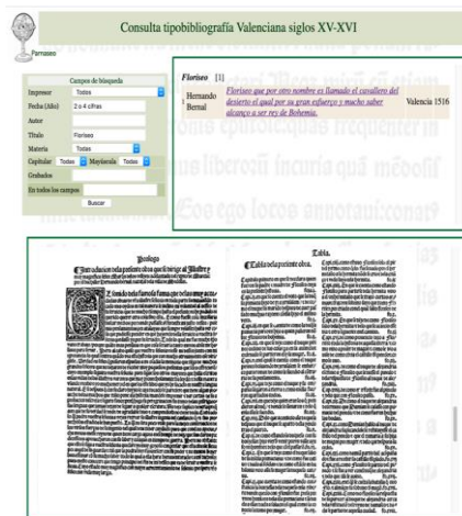
Preliminares del Floriseo (I-II) de Fernando Berrial (Valencia, Diego de Gumiel, 1516)