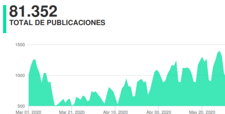
Figura 9. Publicaciones con temática no COVID-19