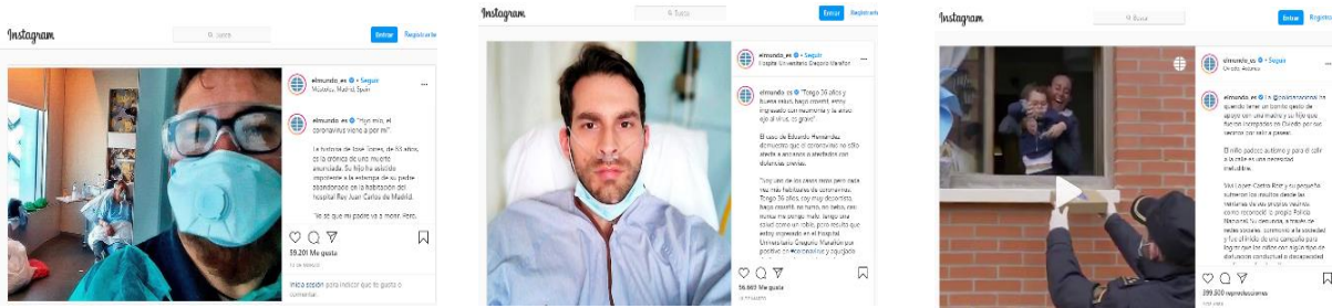
Figura 7. Publicaciones con mayor interacción en Instagram

Por último y en el caso de YouTube, El Mundo vuelve a liderar con su entrevista a Iker Jiménez atrayendo más de 60,8K de interacciones y con otra entrevista que se sitúa en tercera posición (32,1K.). Asimismo, el video sobre el avance de la vacuna española de El País congrega a más de 41,6K., situándose en segunda posición.