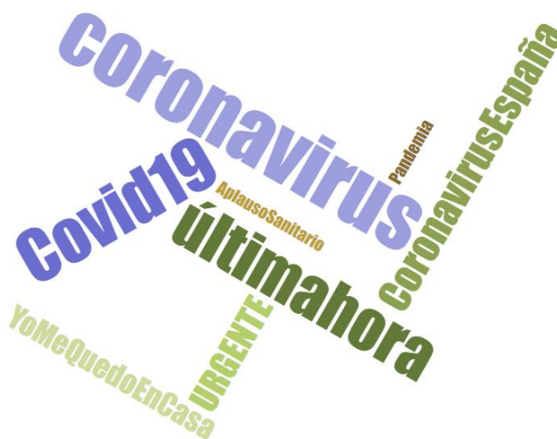
Figura 4. Nube de palabras según los hashtags más empleados

los que más interacciones han congregado. En este sentido, #coronavirus ha sido la etiqueta más empleada durante los tres meses del estudio con más de 3,97 millones de interacciones. Completan las tres primeras plazas: #últimahora (2M.) y #COVID19 (1,57M.). Le siguen en el ranking #CoronavirusEspaña (1,56M.), #Urgente (673K.), #YoMeQuedoEnCasa (596K.) y #Covid_19 (476K.). Completan el TOP10 #Pandemia (465K.) y la etiqueta homenaje a los sanitarios #AplausoSanitario que congregó más de 432K. de interacciones.