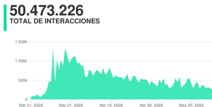
Figura 2: Total de interacciones en redes sociales

de interacciones, viéndose estas muy reducidas durante el mes de mayo en comparación con marzo. El nivel de interacción de los usuarios comenzó a descender a partir del 11 de abril. La investigación evidencia que la tasa de interacción decrece a mayor ritmo que la tasa de publicación durante los meses de abril y mayo. Los medios de comunicación continuaban acaparando sus informaciones con temáticas relacionadas con el virus, pero el interés del público ha ido disminuyendo después del período estival de semana santa, pero manteniéndose constante durante el mes de mayo. En este sentido, nos encontramos una media de interacciones general de 723,17 durante todo el período, concentrando una media de interacciones en marzo de 830,37, en abril de 711,77 (-14,72%) y en mayo de 605,31 (-15,27%).