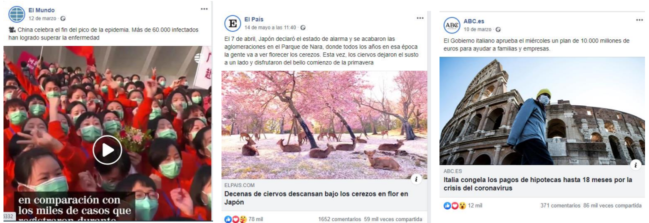
Figura 5. Publicaciones con mayor interacción en Facebook