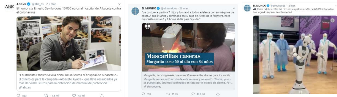
Figura 6. Publicaciones con mayor interacción en Twitter

Al igual que en Facebook, el sector de los medios de prensa congrega la mayor tasa de interacción en Twitter. El perfil de ABC en Twitter acaparó la mayor tasa de interacción con la publicación de Ernesto Sevilla (57,3K.), seguido de El Mundo (56,3K. y 52,3K.). De nuevo, observamos como un contenido con temática internacional se cuela entre los primeros, coincidiendo este en contenido y medio con Facebook.