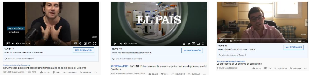
Figura 8. Publicaciones con mayor interacción en YouTube

Por último y en el caso de YouTube, El Mundo vuelve a liderar con su entrevista a Iker Jiménez atrayendo más de 60,8K de interacciones y con otra entrevista que se sitúa en tercera posición (32,1K.). Asimismo, el video sobre el avance de la vacuna española de El País congrega a más de 41,6K., situándose en segunda posición.