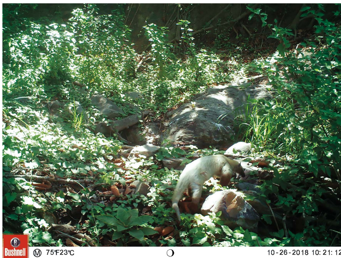
Figura 1. Ejemplar de Tamandua mexicana con pelaje blanco registrado en el bosque de la Comunidad Campesina de San Antonio de Salas (Lambayeque, Perú).

Ocurrencia y hábitats utilizados por la especie en el extremo sur de su distribución. - El noroeste del Perú es el límite sur de la distribución de Tamandua mexicana , sin embargo, su presencia está escasamente documentada en el departamento de Lambayeque (Pacheco et al. 2020) y hasta la fecha no ha sido documentada para el departamento de Cajamarca, donde aún se extiende marginalmente parte de la ecorregión del bosque seco de Tumbes y Piura (CDC-UNALM 2006).