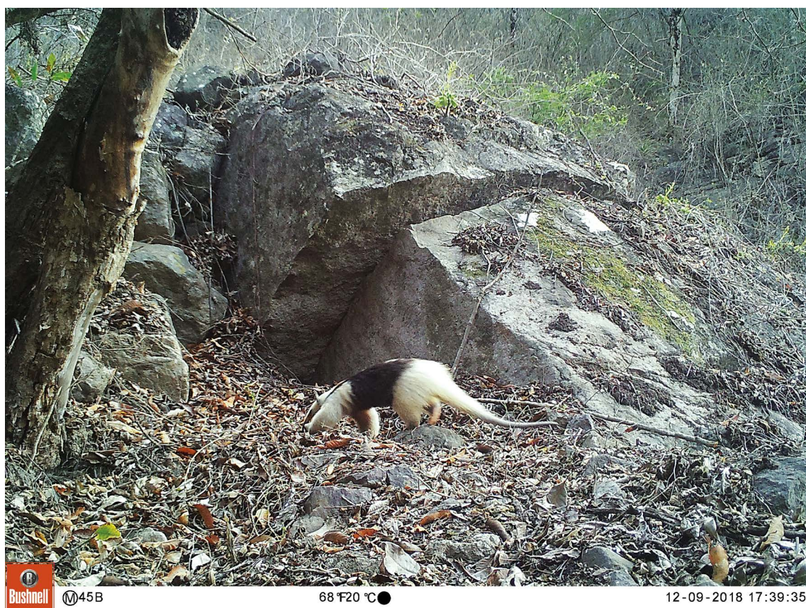
Figura 2. Ejemplar de Tamandua mexicana registrado en el Refugio de Vida Silvestre Udimá (Cajamarca, Perú).