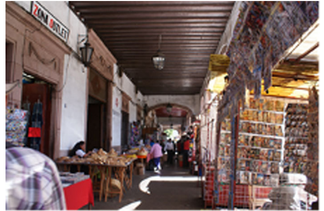
Imagen 1. Comercio informal en los portales de la plaza Gertrudis Bocanegra, Pátzcuaro.

La Isla de Mexcaltitán pertenece al circuito de Origen, que, junto con los circuitos Norte y Playas, conforma la ruta turística denominada Ruta Pueblo Mágico Sol y Playa. Toda la zona noroeste del Estado está enfocada en una actividad turística incipiente y su principal mercado es el regional y nacional (Gobierno de Nayarit, 2009). Mexcaltitán se destaca por emplazamiento natural, su forma urbana circular y su vivienda vernácula.