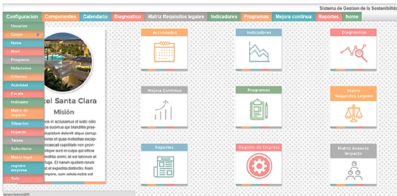
Figura 4. Funcionalidades del sistema NTSOFT

Los resultados del diagnóstico serán tomados como referencia inicial para que el responsable del sistema de gestión determine las debilidades que debe mejorar y las fortalezas que ha de mantener para dar cumplimiento