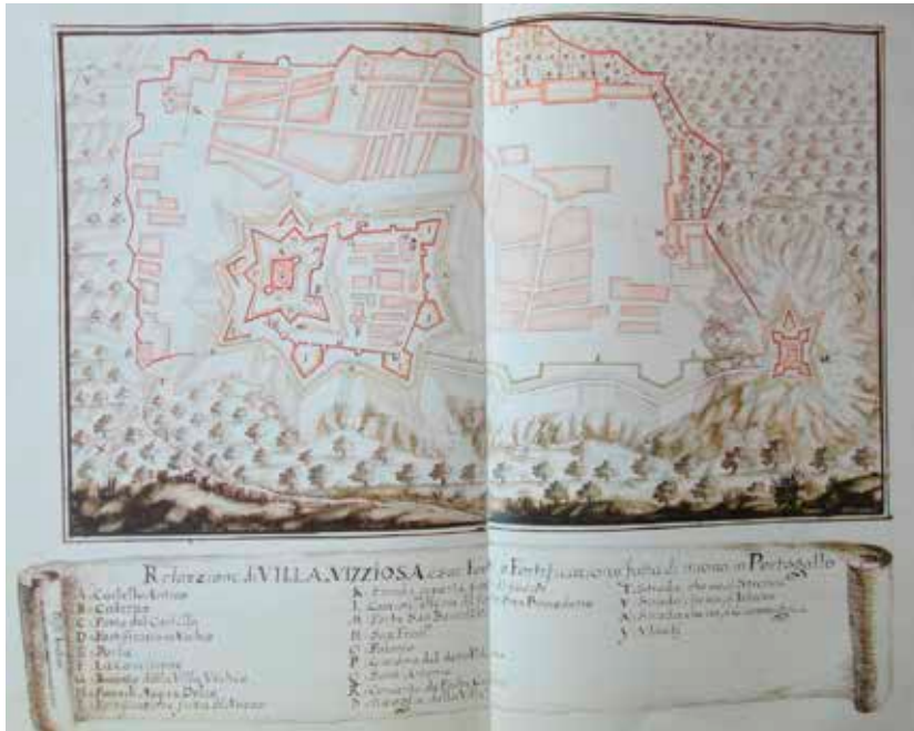
Relazione di Villa Vizziosa e sue forti e fortificazione fatta di nuovo, in Portogallo

El plano de Nicolás de Fer, de principios del siglo XVIII, es prácticamente idéntico; dicho plano está reproducido en la parte superior derecha del mapa de Portugal que en 1705 publica, copiándolo de Pedro Texeira Albernaz, contemporáneo de Lorenzo Possi.