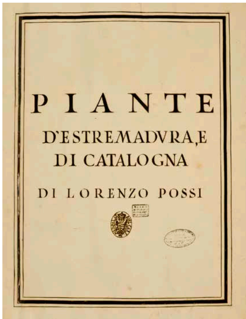
Portada del Atlas.

La obra en sí es una joya -tesoro de la Raya- de alto valor bibliográfico y documental. Un hito en el conocimiento del trabajo de los ingenieros militares de la segunda mitad del siglo XVII. Un descubrimiento con respecto a un autor hasta ahora prácticamente ignorado. Y al mismo tiempo, un ejemplo de metodología en la investigación y en la presentación al gran público de lo investigado.