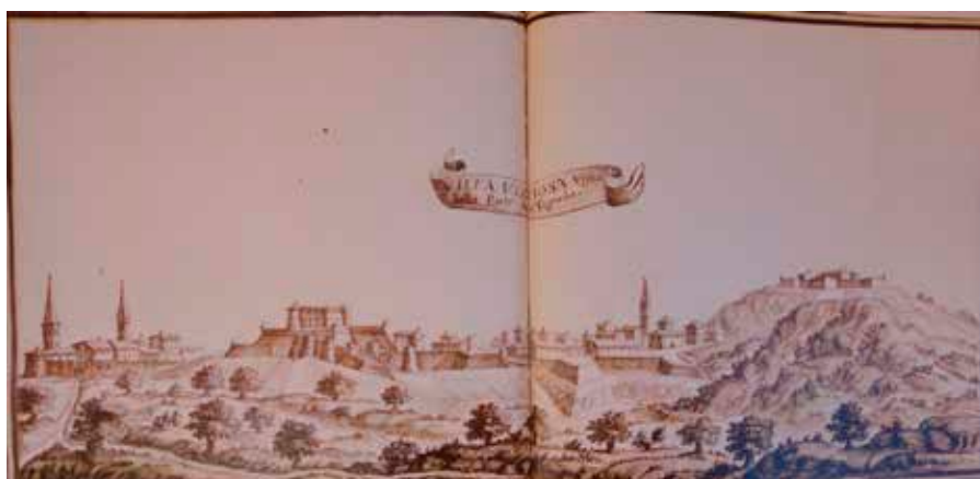
Villa Vizziosa vista dalla parte della Tapada

y donde comenzó a labrarse un nombre y una reputación como ingeniero militar. Integrado en un tercio de napolitanos llegó a la frontera hispano-portuguesa cuando la guerra de Restauração se encontraba en su fase final. El asedio a la plaza de Vila Viçosa y la batalla de Montes Claros en junio de 1665 fueron su bautizo de fuego en esta guerra y el punto de encuentro de Lorenzo Possi con otros ingenieros (la mayoría italianos) que desde entonces trabajarán cerca de él, en las tareas de fortificación y defensa de las principales plazas de esta frontera y de otras en las que trabajarán después. A pesar de la derrota en la batalla de Montes Claros las autoridades reconocieron el buen proceder de Possi y su habilidad como ingeniero, calificándolo de persona experimentada en la materia de las fortificaciones , siendo ascendido a capitán de una de las compañías del tercio de napolitanos”.