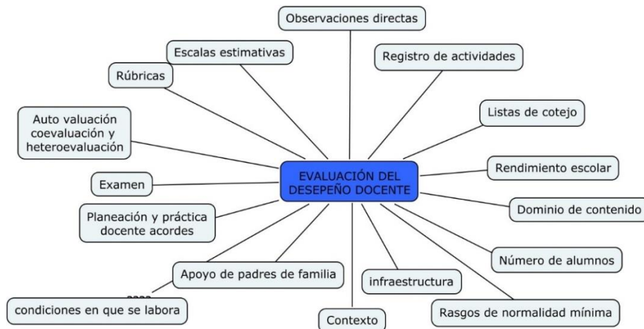
Figura 2.- Evaluación del desempeño docente.

Los profesores que se encuentran frente a grupo, consideran que su desempeño docente no se debe evaluar solo con un examen nacional del rendimiento escolar como ENLACE (o PLANEA), ya que homogeniza a todos los alumnos, no toma en cuenta sus necesidades, ni el contexto donde se desarrolla. Señalan que tampoco es válido valorar su desempeño con un examen diseñado para