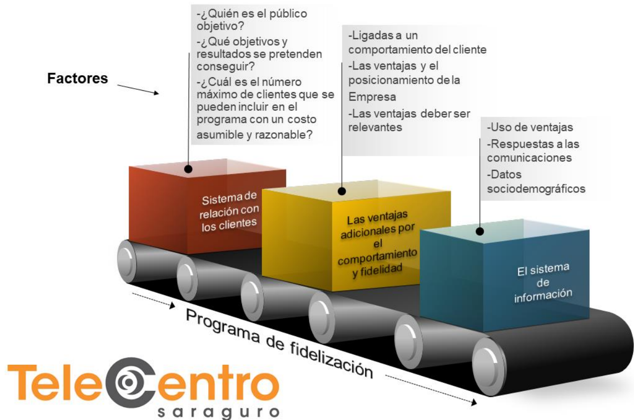
Figura 4. Programas de fidelización.

El programa de la fidelización del cliente es una técnica que tiene mayor efectividad se puede hacer un sistema de relación de los clientes, las ventajas adicionales por la fidelidad y el sistema de información. También podemos optar por estrategias innovadoras como por ejemplo realizar un regalo sorpresa a nuestros mejores embajadores y nombrarlos como socios Vip. En la figura Numero 4 se propone un formato para el programa de fidelización.