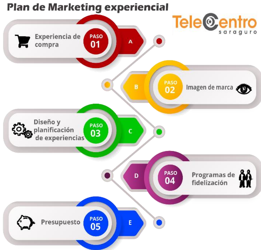
Figura 1. Esquema de propuesta de investigación. Fuente: Los Autores.