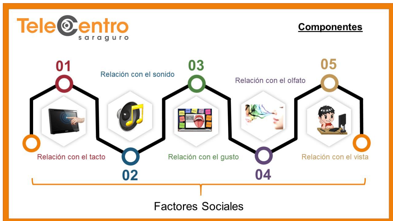
Figura 3. Diseño y planificación de experiencias.

Dentro del marketing experiencial debemos realizar el diseño y la planificación de experiencias que deben ser auténticas, personalizadas y sobre todo memorables, los componentes para el marketing experiencial son el tacto, el sonido, el gusto, el olfato y la vista los mismos que nos ayudaran a llegar al cliente en la forma creativa y memorable creando vínculos personales y con los factores sociales. En la figura número 3 se enfoca la propuesta de las experiencias.