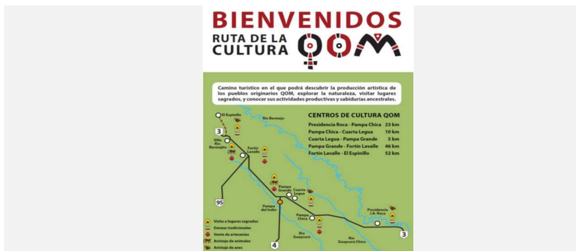
Imagen emplazada en carteles a lo largo de la Ruta Provincial N° 3