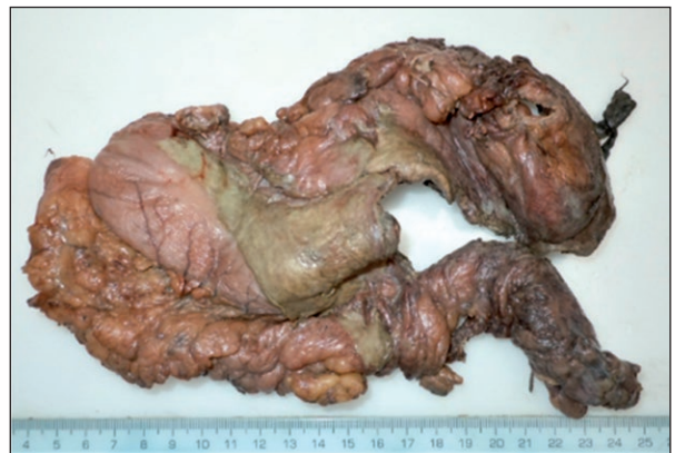
Figura 1. Macroscopía de pared gástrica con extensa perforación, bordes necróticos y áreas cubiertas por fibrina.

El estudio de anatomía patológica de las piezas operatorias del estómago y colon (Figura 1) indica necrosis isquémica con severo infiltrado inflamatorio y trombos vasculares en cuya luz y pared se aprecian múltiples estructuras micóticas, anchas, sin septos, con hifas poco ramificadas y angulación en 90^\circ y cuyas características morfológicas corresponden a mucor sp (Figuras 2 y 3). La necropsia informa proceso infeccioso micótico necrotizante multisistémico, morfológicamente compatible con mucormicosis invasiva diseminada. Hubo compromiso de pulmón, intestino, estómago, diafragma, hígado, riñón, glándula suprarrenal, pericardio, aorta, páncreas y bordes de la herida operatoria. Adicionalmente, se encontró aspergilosis pulmonar, con cultivos bacterianos negativos.