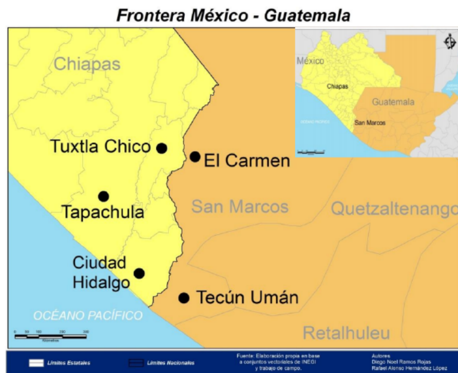
Figura 1. Frontera Ciudad Hidalgo (México)-Tecún Umán (Guatemala)