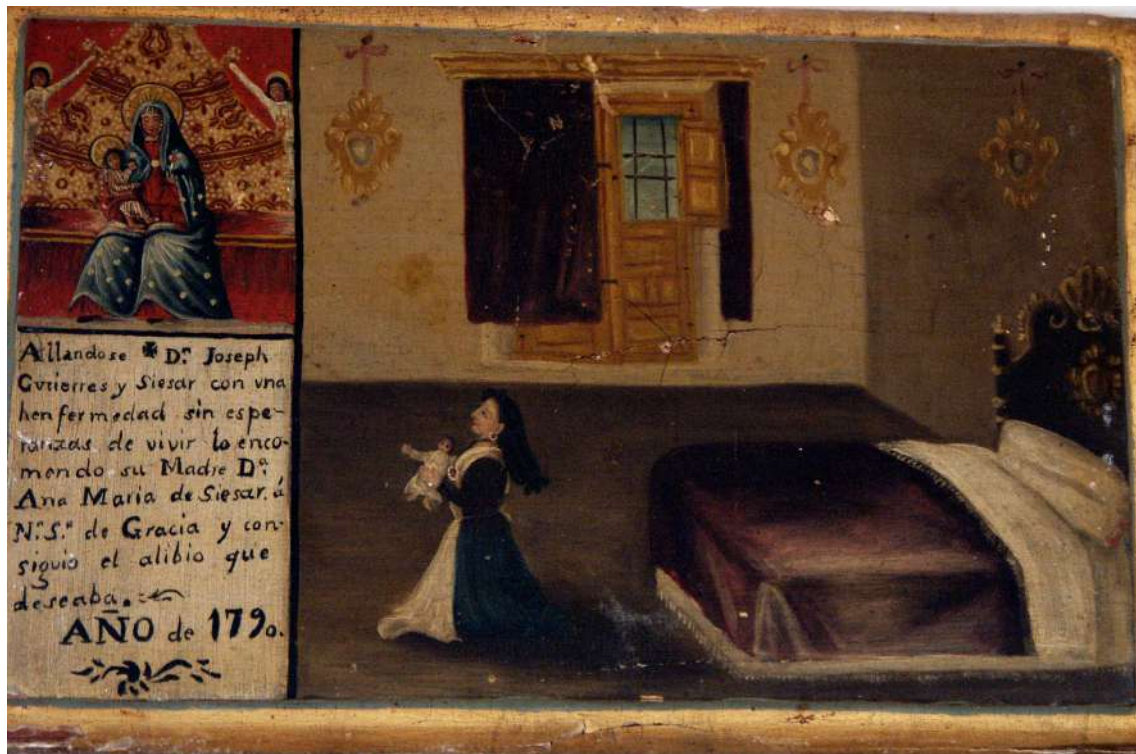
Fig. 3 Santuario de Nuestra Señora de Gracia. Archidona (Málaga)