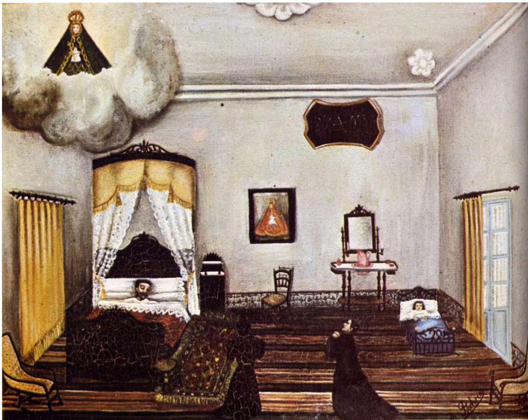
Fig. 8 Santuario de Nuestra Señora de los Santos. Alcalá de los Gazules (Cádiz)