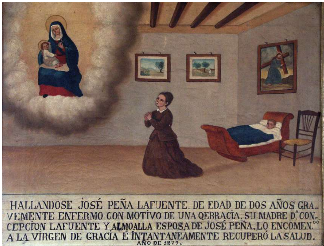
Fig. 5 Santuario de Nuestra Señora de Gracia. Archidona (Málaga)