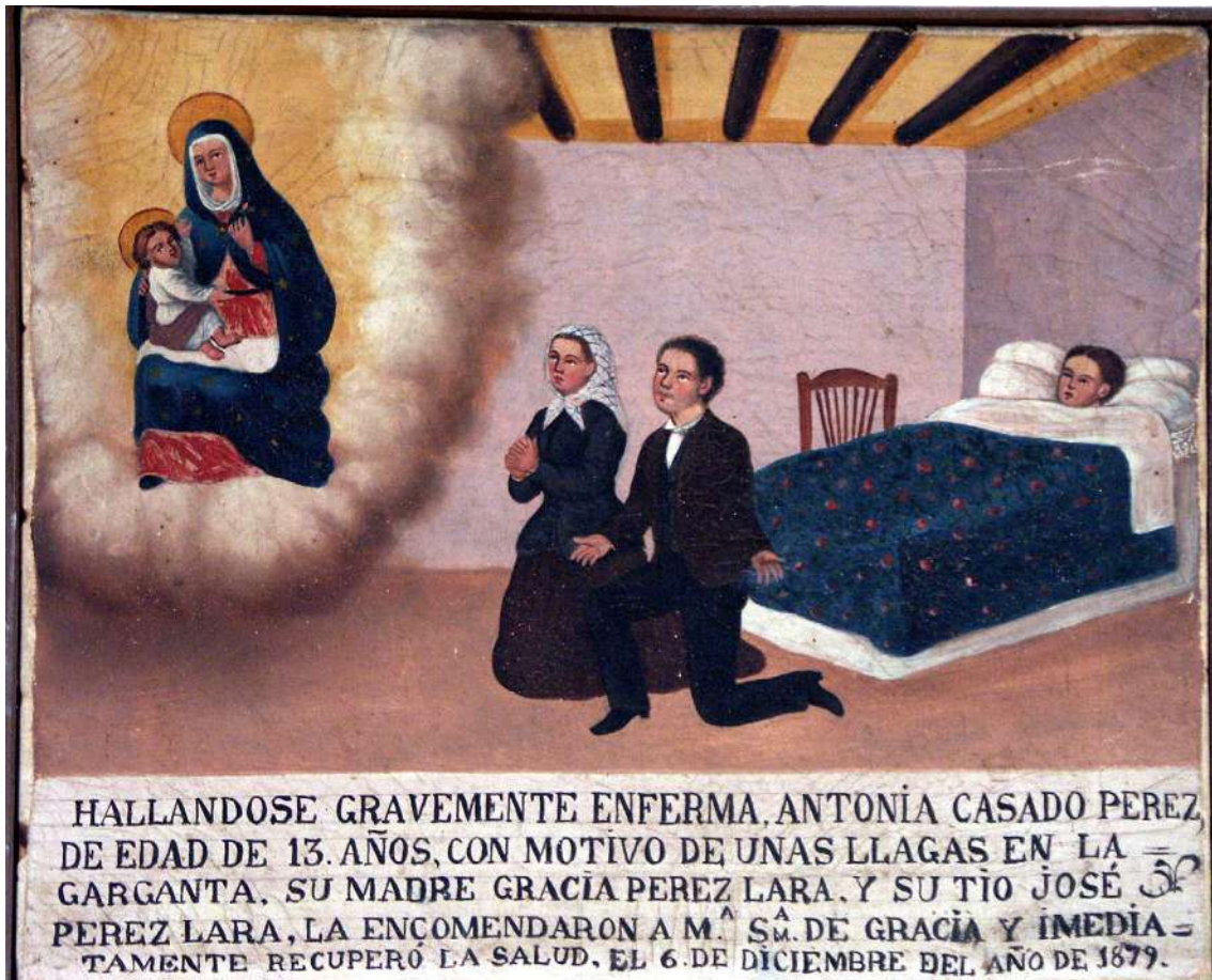
Fig. 2 Santuario de Nuestra Señora de Gracia. Archidona (Málaga)