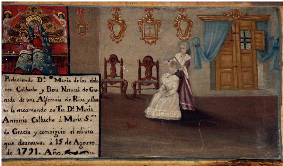
Fig. 10 Santuario de Nuestra Señora de Gracia. Archidona (Málaga)