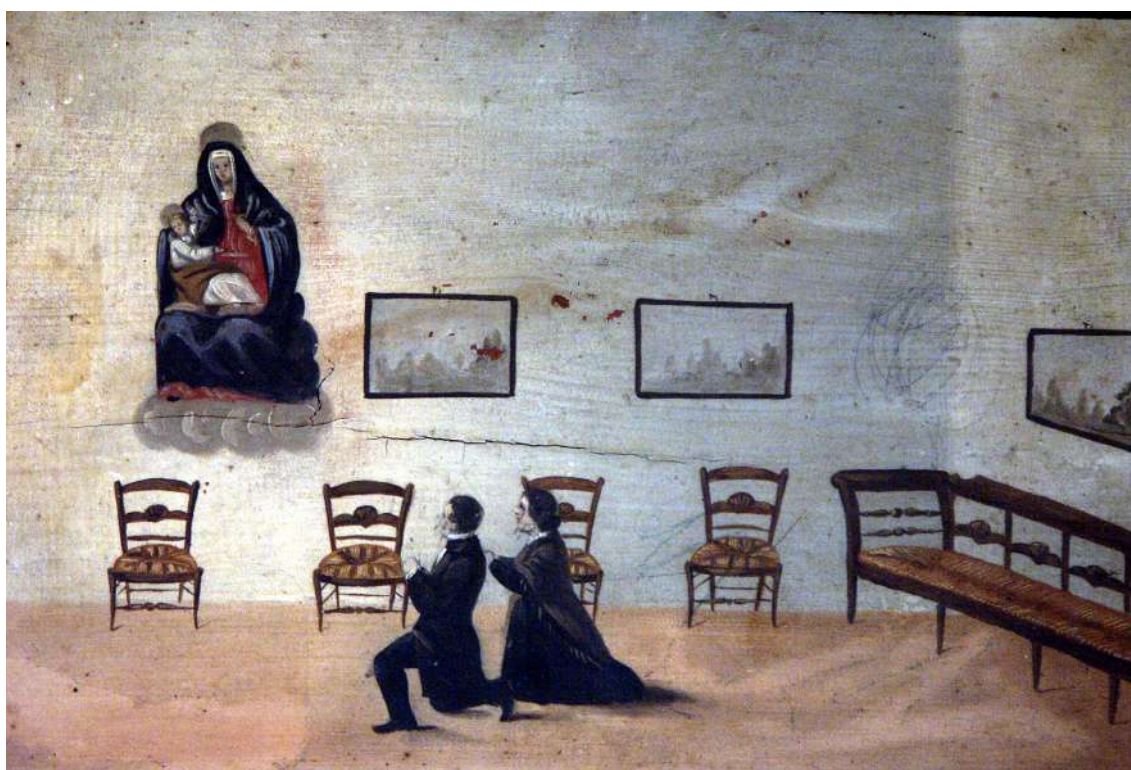
Fig. 12 Santuario de Nuestra Señora de Gracia. Archidona (Málaga)

En el estilo isabelino se busca el confort por lo que el tapizado es la novedad más importante en los asientos para una mayor comodidad, como los brazos de los sillones que se almohadillan, buscando el mencionado bienestar. En un primer momento los respaldos son planos para, finalmente, adoptar formas ovales, casi siempre sin tallas, propiciando un modelo sencillo y elegante que caracterizó los asientos de ese período. Por último, hay que señalar que a pesar del desarrollo que tuvo en el período isabelino, la consola y la pequeña mesa denominada velador, rara vez aparecen representados en los exvotos, lo que avala que fue un mueble de lujo, destinado a la burguesía.