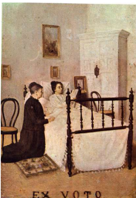
Fig. 9 Santuario de Nuestra Señora de Regla. Chipiona (Cádiz)