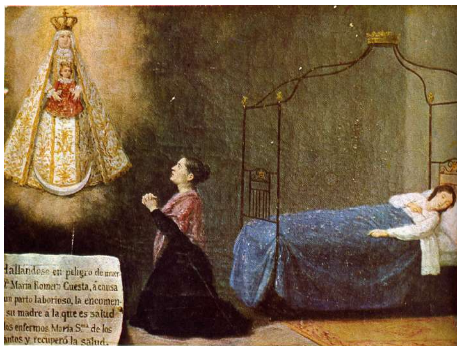
Fig. 6 Santuario de Nuestra Señora de los Santos. Alcalá de los Gazules (Cádiz)

Antes de la difusión de la fontanería era frecuente en los dormitorios el lavabo o palanganero, estructura de madera o hierro de unos 85 centímetros de alto donde se colocaba la palangana para asearse. Se componía de un cerco donde encajaba el recipiente, prolongándose en los extremos en forma de asas donde se colgaban las toallas. En la parte inferior se disponía una plataforma para colocar la jarra con el agua. El conjunto se completaba con un espejo enmarcado por la prolongación de las patas traseras. Aunque fue muy usual en los dormitorios de fin del Ochocientos, en los exvotos analizados no son muy frecuentes a excepción de los localizados en la ermita de Nuestra Señora de los Santos de Alcalá de los Gazules (Cádiz), de los más descriptivo en cuanto al mobiliario de una alcoba en esos años. 19 (fig. 8)