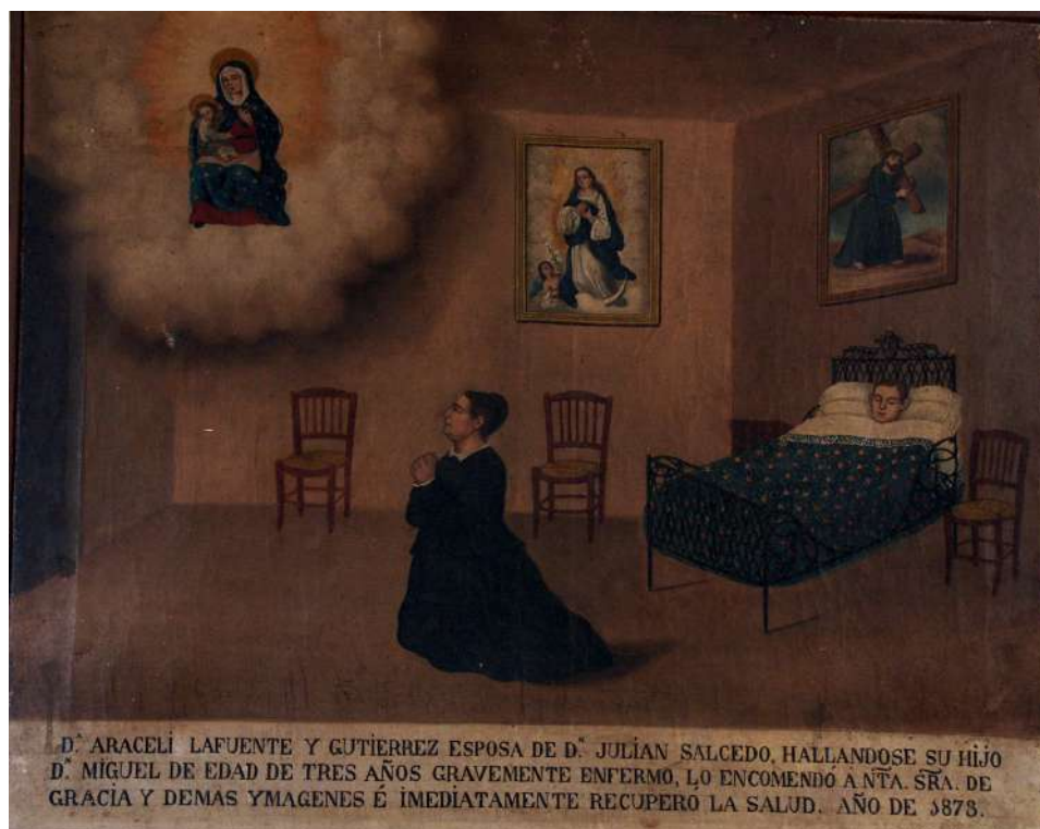
Fig. 1 Santuario de Nuestra Señora de Gracia. Archidona (Málaga)