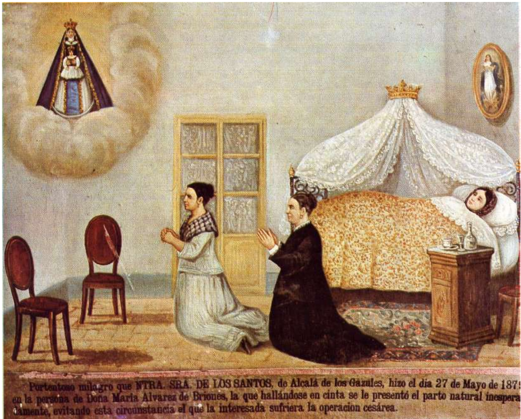
Fig. 7 Santuario de Nuestra Señora de los Santos. Alcalá de los Gazules (Cádiz)