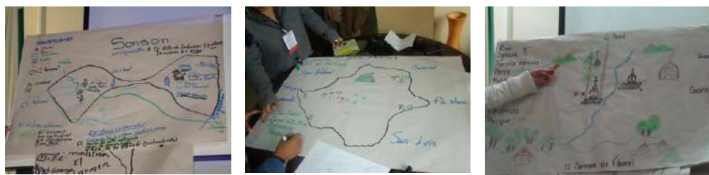
Ejemplo de los mapas mentales realizados por los docentes en los talleres.

En los mapas logrados por los docentes de la subregión, se muestra el territorio de existencia física y real desde el significado sociocultural, el espacio social, con una existencia subjetiva y colectiva, con diversos significados a través de los cuales lo real-objetivo es filtrado y se entremezcla con sensaciones, emociones, estereotipos, etc. Pero además, son representaciones pensadas en el contexto del estudio de los lugares desde el aula, es decir con una intencionalidad didáctica.