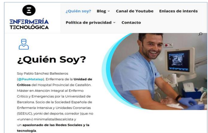
Imagen 7: Enfermería Tecnológica de Pau.

Os dejo un Twit (imagen 8), publicado por Pablo, con su particular estilo, para apoyar la campaña #NOALPLAGIO