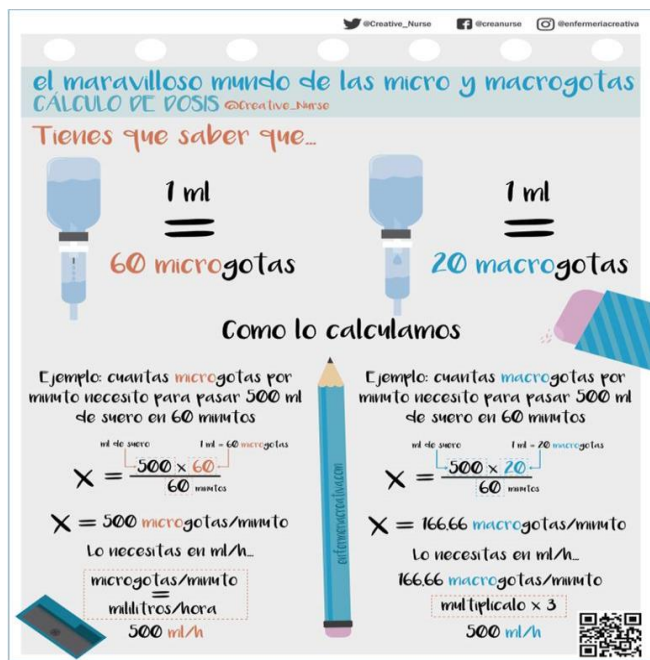
Imagen 6: Cálculo de dosis en sueroterapia.

También publica desde un tutorial sobre cómo realizar una infografía a gráficos con diversas reglas nemotécnicas (Imagen 6).