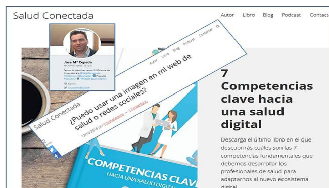
Imagen 2: Salud Conectada.

En su Web "Salud Conectada" recopila gran cantidad de información y contenidos https://saludconectada.com/blog/ (Imagen 2).