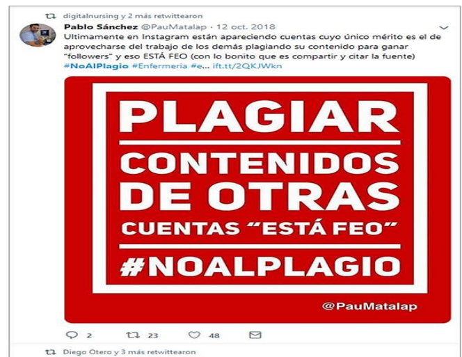
Imagen 8: @PauMatalap y #NOALPLAGIO .

Destacar también su página de Facebook https://www.facebook.com/EnfermeriaTecnologica/ desde la que nos mantiene informados de todas las publicaciones de Enfermería Tecnológica.