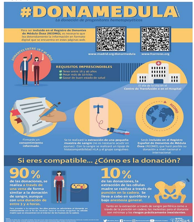
Imagen 5: Campaña: Dona Médula.

Otro aspecto a destacar de Silvia es su altruismo y participación en diversas campañas altruistas, como "Dona Médula" (imagen 5).