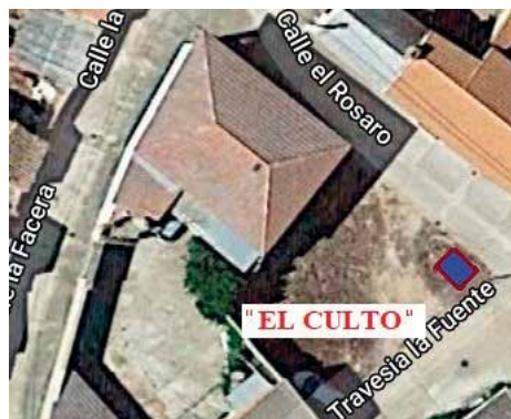
Fig.5. Barco del Barco “El Culto” y baptisterio.

Las celebraciones, de periodicidad anual, fueron actos públicos que agruparon a muchas personas. Los bautizados de la Asamblea de Hermanos eran adultos conscientes de su fe que después de un periodo de preparación asistían hacia la “bajada a las aguas” recordando los bautismos de los primeros cristianos. Al ritual asistían diversos catecúmenos vestidos de blanco, el oficiante normalmente el predicador inglés descendía a la piscina cubriéndose de agua hasta la cintura y dispuesto frente al público. Posteriormente, descendía el catecúmeno que se ponía de perfil cruzando las manos sobre su pecho. El oficiante le hacía unas preguntas sobre las bases de su fe en voz alta. Por último, el celebrante introducía en el agua de espaldas al neófito cubriéndole por unos segundos con el agua todo el cuerpo. El simbolismo, muy conocido, significaba la muerte del pecado y el “mundo” y la resurrección del catecúmeno a la vida en Cristo. 57