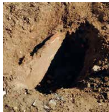
Fig.6. Pared interna del baptisterio.