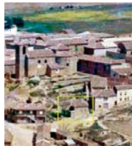
Fig. 4. La llamada capilla de los protestantes en una foto aérea de Castrogonzalo de 1983

Algunas comunidades evangélicas asentadas en España en el último tercio del siglo XIX influyeron en Zamora 49 y fueron los predicadores ingleses D. Manuel Chapman y D. Guillermo Willies a principios de la centuria siguiente los encargados de organizar a aquellas personas que decidieron abrazar una nueva forma de practicar el cristianismo en el área de Benavente, principalmente en los pueblos de Castrogonzalo y Barcial del Barco 50 . Las reuniones se empezaron a organizar en graneros, pajares, lugares fáciles de adquirir entre algún vecino que pudieran acomodar a un grupo de personas. 51 Cuando llegó Arturo Shallis en 1916 residió primeramente en Barcial comenzando su labor evangélica y muy probablemente reorganizando la congregación. Aunque posteriormente se trasladó a Castrogonzalo, visitó Barcial del Barco una vez a la semana “A pesar de el fuerte temporal que hubiere de agua y de nieve” 52 consiguiendo mantener la fe de los prosélitos. 53 En Barcial del Barco se estableció una capilla de Asamblea de Hermanos en el solar conocido actualmente por los vecinos como “El culto” donde hemos encontrado gracias a la ayuda de un vecino del pueblo y otros colaboradores un baptisterio, en el que se realizaba el bautismo por inmersión 54 . “El