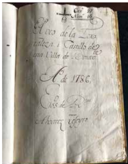
Fig. 5 Apeo de la Fortaleza y Castillo de esta villa de Benavente. 1786.

A solicitud de los Condes Duques de Benavente se realizan los apeos siguientes: término redondo de Piquillos, Brive; Santa Elena, Santa María Magdalena de Boldones y la Fortaleza de Benavente (primeras cuatro páginas). El grueso, con letra de otro escribano, se refiere a esta (39 hojas): Apeo de la Fortaleza i Castillo de esta villa de Benavente. Año 1786. Estados de rentas. Álvarez Teseiro 40 .