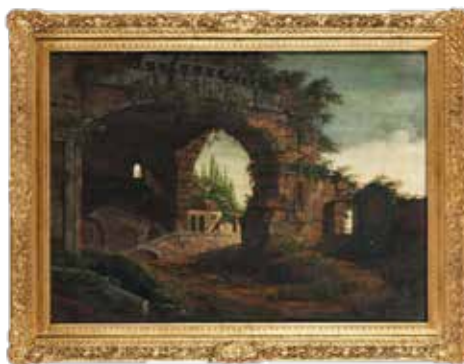
Fig. 2 b. Ruinas romanas desconocidas. Subasta Hampel. 2 abril 2020.

De forma inimaginable ambos lienzos “resurgieron”, como por ensalmo, en la subasta de 2 de abril de 2020 (Lote 525) de la casa Hampel de Munich con un precio (estimado) entre: 8.000€-12.000€ y una expertización bastante menos desacertada que la de Durán, asignándolos a un pintor de los siglos XVIII-XIX. Personados en la subasta, en esta ocasión los mismos “cuadros pródigos” no se nos escaparon, y a menor precio del previsto, 7000€, más 29,50% de tasas, 100€ de gastos de envío y 27€ bancarios.