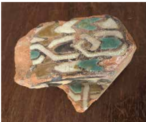
Fig. 1. Pieza de revestimiento arquitectónico en cuerda seca.

La pieza de sección rectangular de 5 cm de ancho x 10,50 de largo x 16,7 cm de alto presenta dos aletas o pestañas laterales también decoradas por el mismo motivo de entrelazo o ataurique geométrico mientras las caras verticales lo hacen con un sencillo diente de sierra en negro sobre fondo blanco. Los colores: verde, blanco, negro y melado son los denominados “colores árabes” tradicionales. Aparentemente podría confundirse con un alízar 25 empleado para rematar aristas o narices de peldaños de escaleras, alféizares de ventanas, esquinas de pared o mesas de altar, sin embargo su perfil no es en L, como en estos.