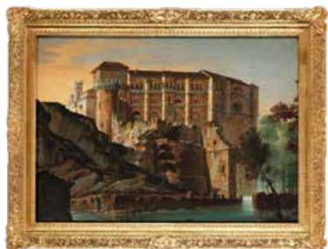
Fig. 2 a. Castillo de Benavente. Subasta Hampel. 2 abril 2020.