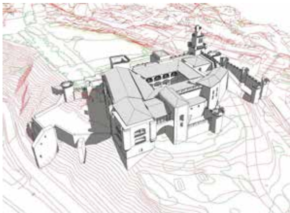
Fig. 6 b. Recreación en 3D de la fortaleza de Benavente, según Isidro Lorenzo San Miguel.