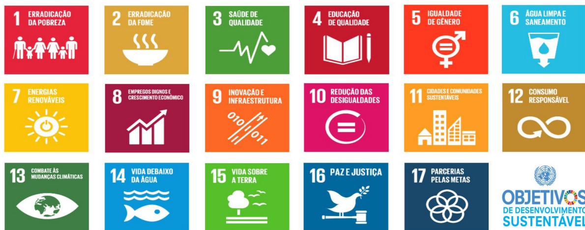
Figura 1. Os objetivos de desenvolvimento sustentável

A Agenda 2030, a qual visa ao desenvolvimento sustentável, foi aprovada pelos países membros da Organização das Nações Unidas (ONU) por consenso durante a 70 a Assembleia Geral da ONU, em setembro de 2015. O lema do documento é: “Ninguém pode ficar de fora!” (ONU, 2015, p. 27). Dentro da Agenda 2030, foram evidenciados 17 ODS (Figura 1), os quais buscam concretizar os direitos humanos de todos e alcançar a igualdade de gênero e o empoderamento das mulheres. Eles são integrados, indivisíveis e equilibram as três dimensões do desenvolvimento sustentável: econômica, social e ambiental.