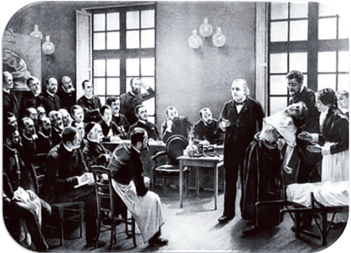
Imagen 8. André Brouillet, 1887. Una lección sobre histeria por Jean Martin Charcot.

Sabemos que la placa fotográfica no es sensible a los mismos rayos que nuestra retina: así pues, podrá, en ciertos casos, mostrarnos más que el ojo, revelarnos aquello que éste no es capaz de percibir. Esta sensibilidad particular cobra un valor muy especial y no es, en mi opinión, la propiedad menos importante de la fotografía.