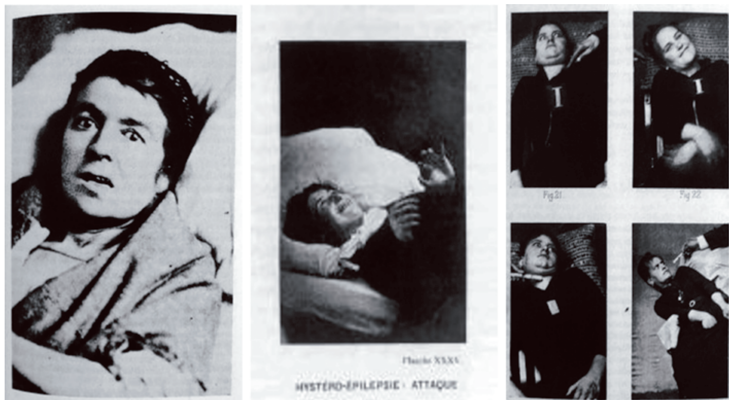
Imagen 10. Fotografías de la Salpêtrière

Si planteamos que el ojo de la ciencia se cree portador de la mirada, tendremos que convocar el sujeto del inconsciente al que la mirada se le escapa. La idea de poder captar la imagen de la locura con la ilustración científica pudo verse como la conquista de esa alma ingobernable que seduce a caer en la creencia de la representación.