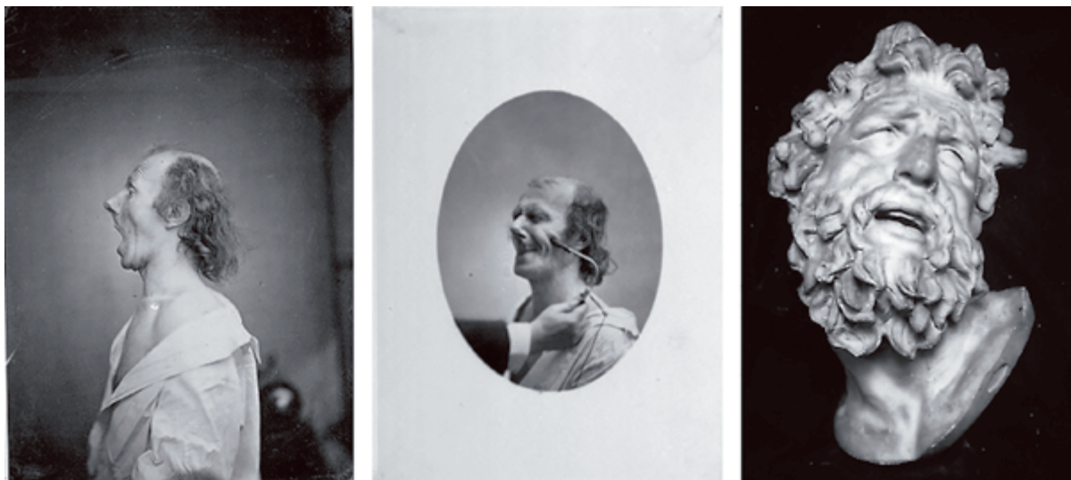
Imagen 3. Mecanismo de la fisonomía humana.

Para Duchenne de Boulogne las corrientes eléctricas sobre los músculos faciales abrían la ventana del espíritu, la expresión facial sería pura superficie hablante de la que es posible extraer de una medición técnica. En consecuencia el uso de la fotografía funciona para el experimento como un ornamento funcional a la idea de captar el tiempo y el objeto en su condición de manifestación de la locura. Produciendo series y repeticiones comparables, inicia como una forma de interés científico pero pasa del lado de lo fantástico, de la invención que llega a manifestarse en su aspecto más teatral. Se puede revisar en los textos que acompañan originalmente las fotografías, que evidentemente representar las emociones a través de estos experimentos tuvo que ver más con un interés estético y que el uso de fotografías en los ámbitos científicos de la época era pura cuestión de prestigio.