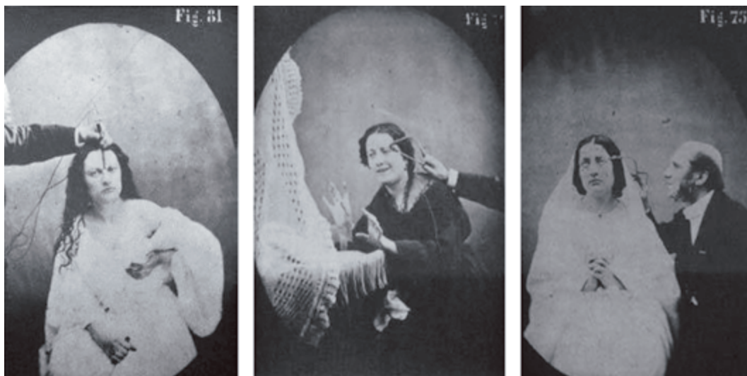
Imagen 4. Fotografías sin título sobre el mecanismo de la fisonomía humana

Las mujeres que aparecen en las fotografías caracterizaban personajes clásicos de la literatura universal como Lady Macbeth, quien sostiene un puñal, y dirige su mirada hacia fuera de la cámara, el médico, continúa sosteniendo su maquina de estimulación eléctrica. Las acciones representadas transportan un marcado componente misógino en el que las mujeres son títeres que completan el saber del médico, la teatralización del otro, se despliega a la manera de un espectáculo teatral, donde las figuras míticas, desde las cuales se ha interpretado la locura, se instalan, haciendo que la ficción y el experimento se confundan.