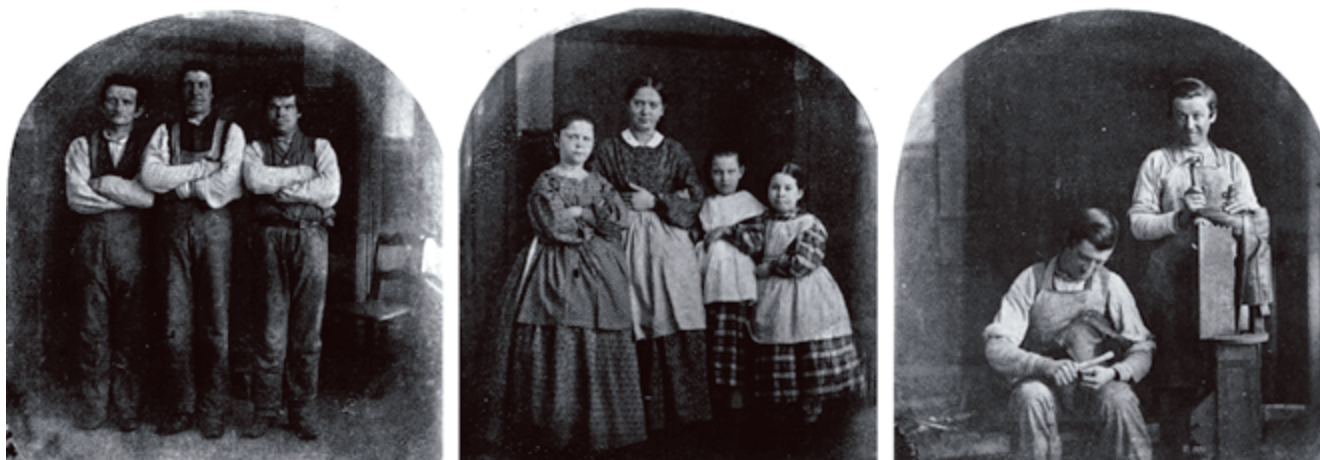
Imagen 7. Álbum fotográfico de la Escuela de entrenamiento para niños y adultos débiles mentales (ca. 1867-1875)

Abajo en las tres fotografías de grupo, la imagen central es la idea de laboriosidad, la práctica de un oficio asegura el reemplazo de la vagancia o desocupación asociada a la locura, el retrato de la cotidianidad muestra esta vida apacible que proporciona la institución mental. Es la metáfora de una vida casi familiar como la representada en la retórica retratística del siglo XIX.