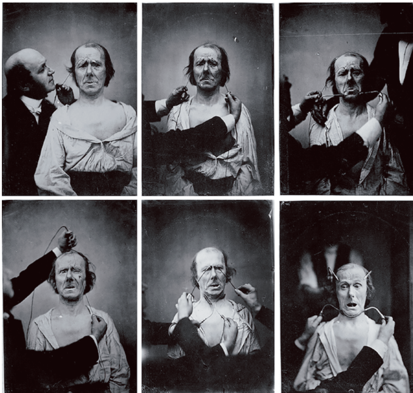
Imagen 2. Mecanismo de la fisonomía humana Fuente: Guillaume Duchenne de Boulogne, 1862.

Mecanismo de la fisonomía humana, o análisis electrofisiológico de la expresión de las pasiones, por el doctor Duchenne de Boulogne. Con un atlas compuesto de 74 figuras electrofisiológicas fotografiadas. París: J. Renouard.