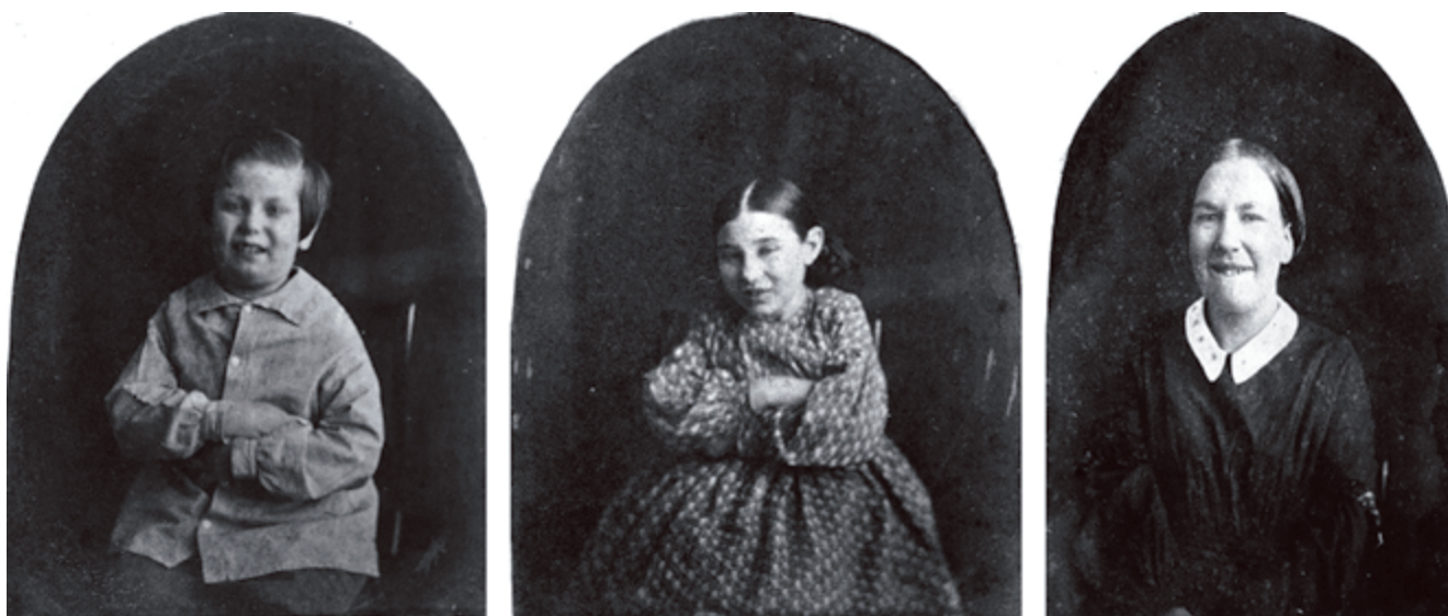
Imagen 5. Álbum fotográfico de la Escuela de entrenamiento para niños y adultos débiles mentales (ca. 1867-1875)

Esta idea de álbum fotográfico fue tomada de los usos que empezaba a cumplir la fotografía al final del Siglo XIX, en donde se empieza a generalizar la fotografía del retrato individual y de grupos familiares, en este caso, el álbum funciona como souvenir que la institución produce para demostrar el trabajo que ha depositado en estos pacientes.