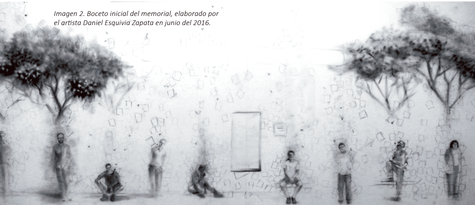
Imagen 2. Boceto inicial del memorial, elaborado por el artista Daniel Esquivia Zapata en junio del 2016.