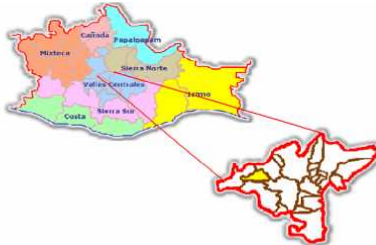
Figura 1. Mapa del Estado de Oaxaca, ubicación del municipio donde se realizó la investigación

Desde una perspectiva agroecológica, se analizaron la diversidad de plantas que caracterizan a los huertos familiares, los usos y el manejo de las diversas especies vegetales.