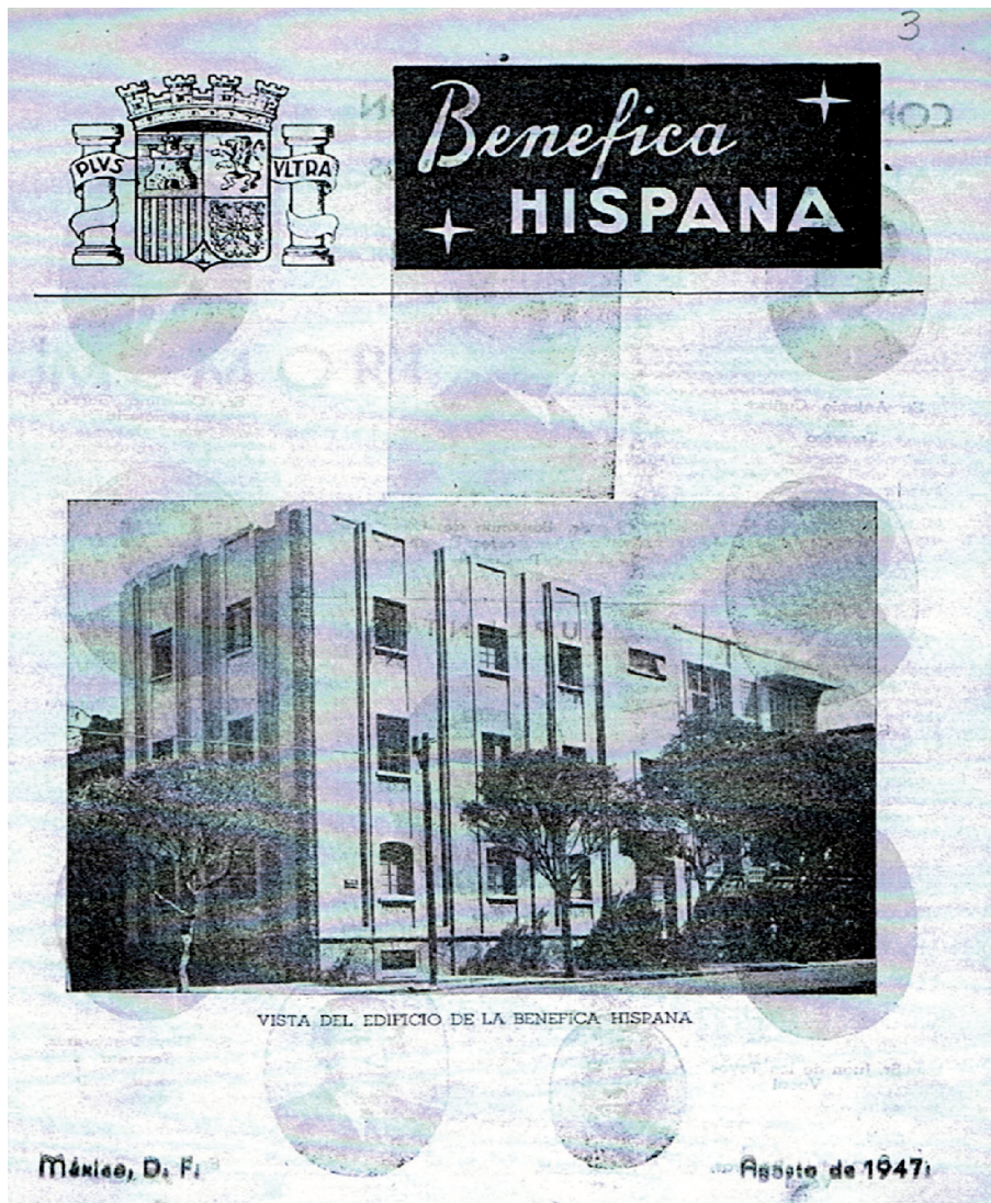
Imagen 3 Vista del edificio de la Benéfica Hispana, Ciudad de México, calle Marsella n.º 58, agosto de 1947.