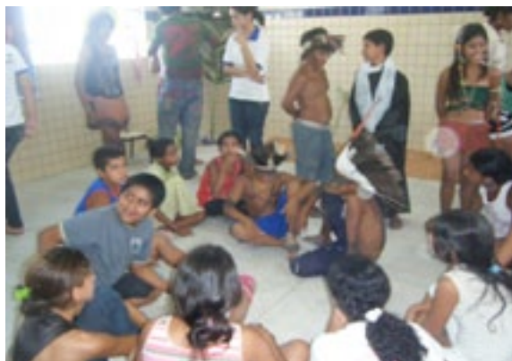
Fotografia 9: Estudantes da Escola Indígena Fulni-ô Marechal Rondon em apresentação teatral em maio de 2010.