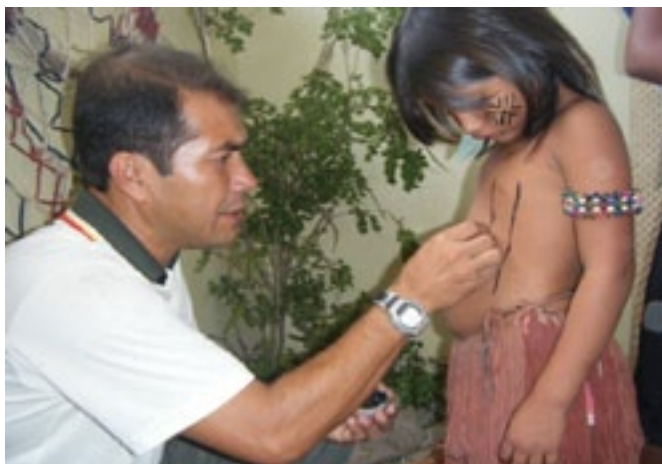
Fotografia 7: Professor e estudante da Escola Indígena Fulni-ô Marechal Rondon realizando pintura corporal.