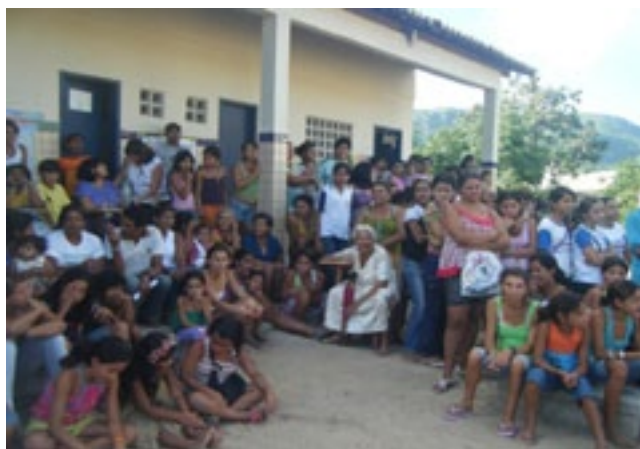
Fotografia 5: Comunidade Escolar da Escola Indígena Fulni-ô Marechal Rondon durante a exposição na escola em maio de 2010.