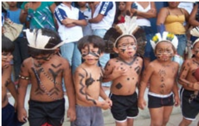
Fotografia 8: Fotografia dos educandos da Escola Indígena Fulni-ô Marechal Rondon em atividades de dança e cânticos em maio de 2010.