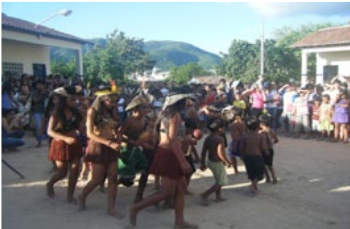
Fotografia 11: Estudantes da Escola Indígena Fulni-ô Marechal Rondon em apresentação de canto e dança em maio de 2010.