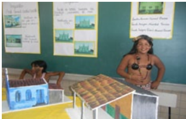
Fotografia 12: Estudantes da Escola Indígena Fulni-ô Marechal Rondon apresentando a história do seu povo em maio de 2010.