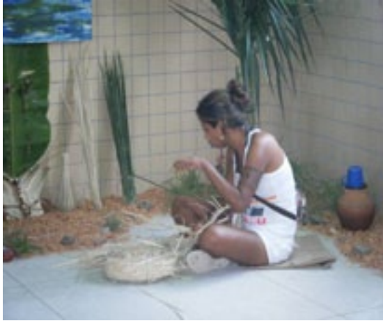
Fotografia 10: Estudante da Escola Indígena Fulni-ô Marechal Rondon produzindo artesanato em maio de 2010.