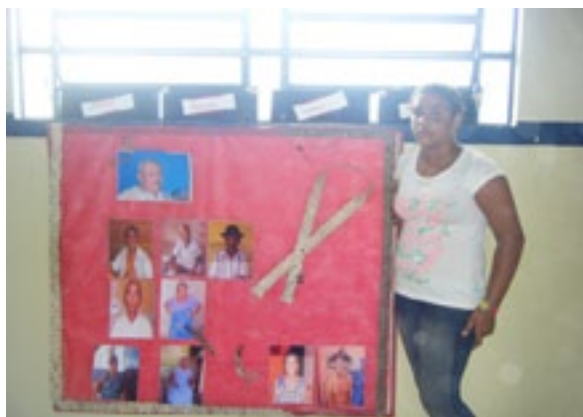
Fotografia 13: Estudante da Escola Indígena Fulni-ô Marechal Rondon expondo seu trabalho sobre as lideranças da etnia em maio de 2010.