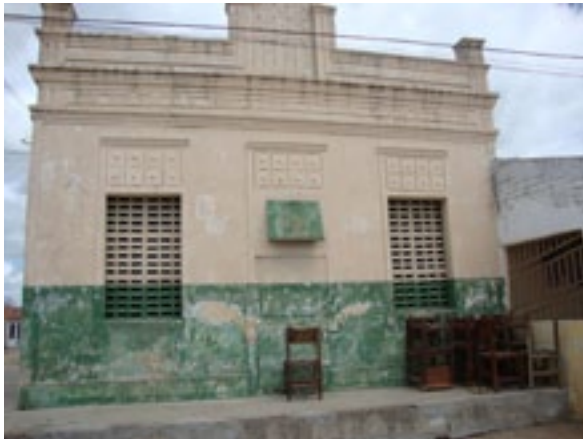
Fotografia 2: Primeiro prédio da Escola Indígena Fulni-ô Marechal Rondon construído em 20 de abril de 1929.