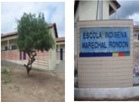
Fotografia 3: Escola Indígena Fulni-ô Marechal Rondon