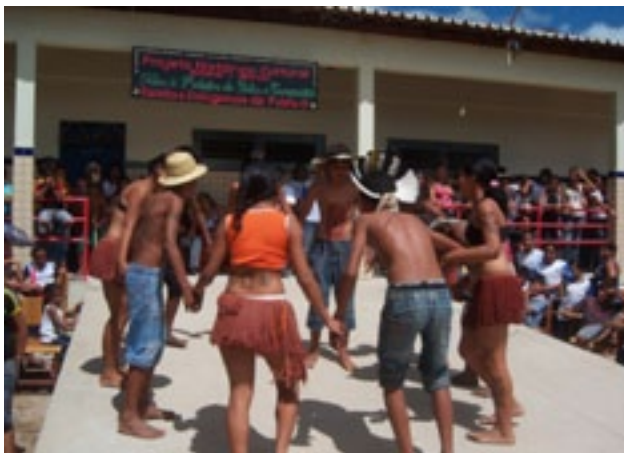
Fotografia 6: Grupo de dança com estudantes da Escola Indígena Fulni-ô Marechal Rondon em maio de 2010.