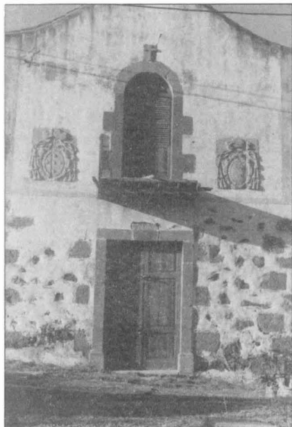
Escudos procedentes del convento de San Ildefonso, hoy en una casa en La Hoya del Parrado

El obispo Cámara fundó en 1634 el convento de monjas bernardas descalzas o recoletas de San Ildefonso, que ocupaba con su iglesia y huerta toda una manzana (18) .