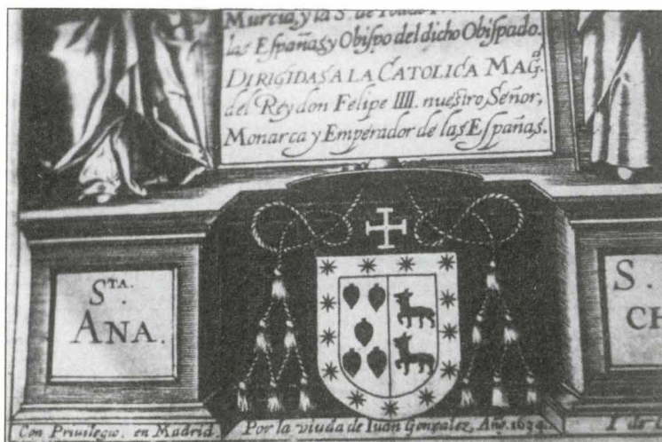
Escudo en la portada de la segunda edición de las Sinodales

En el frontispicio de esta segunda edición aparece un grabado con la inscripción “I. de Courbes F.”, se trata de la firma de Juan de Courbes. Para José Manuel Matilla, que ha realizado un hermoso estudio sobre su obra, este artista, nacido en París en 1592, es “de entre todos los grabadores franceses que llegaron a España en la primera mitad del siglo XVII, sin duda alguna el que logra una mayor calidad técnica en su producción”. Así como el único que consiguió cierto éxito dentro del sector tipográfico madrileño, a lo que no debió ser ajeno el hecho de que su hermano Jerónimo fuera ya un conocido librero de Madrid (11) .