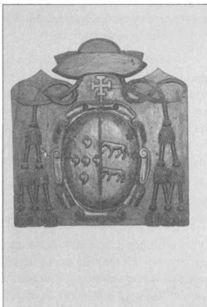
Uno de los escudos gemelos procedentes del convento de San Ildefonso, hoy en el Museo Canario

La entrada principal del convento estaba en la calle de la Vera Cruz, hoy Doctor Chil. La sencilla fachada de la pequeña iglesia miraba a la calle de San Marcos. Fue el único de los seis conventos de la ciudad que sobrevivió