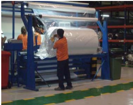
Figura 2. Embalagem de rolo de 240m

coluna lombar associados às tarefas de elevação, mas também doenças nos ombros ou dores nos braços, servindo ainda como auxiliar para a adoção de soluções ergonómicas mais eficazes para evitar as tensões físicas associadas à elevação manual de cargas. Antes da discussão dos resultados da avaliação, estão apresentadas nas figuras 2 e 3 as tarefas em avaliação.