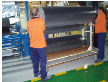
Figura 3. Colocação do rolo no cavalete