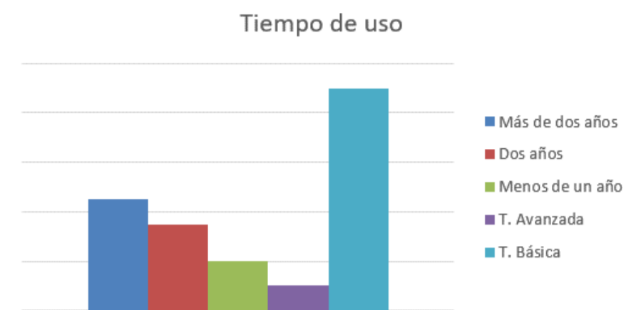
Gráfico 2. Tiempo de uso y tecnología de los audífonos