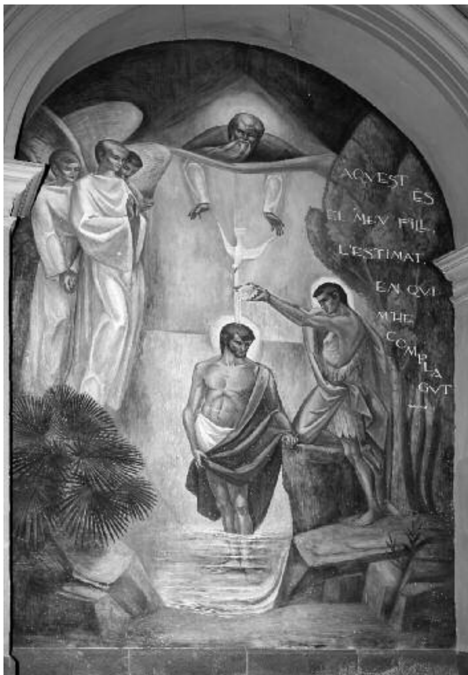
Representació del bateig de Jesús.