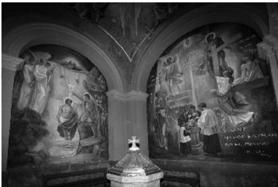
Les dues parets laterals del baptisteri de la Parròquia de Sant Feliu de Constantí, amb les pintures murals obra d'Anton Català Gomis.

La pintura mural que el pare va fer aquí a Constantí, a la parròquia de Sant Feliu l'any 1965, va ser una obra molt madura. Portava ja vint-i-cinc anys fent grans murals en els quals s'hi sentia amo de la composició i de l'adaptació a l'espai disponible. El seu estil, ja molt personal, es caracteritza per l'ús de les línies rectes i els angles aguts que estilitzen el dibuix i li donen una seguretat enorme en el traç. Les figures molt altes augmenten la seva elegància i les lletres formen part de la pròpia composició.