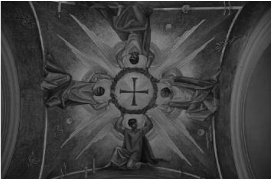
El sostre del baptisteri amb quatre àngels.

Davensol crític vallenc d'art, comentant l'obra del pare deia: «És un art d'equilibri i de puresa, de calma i de repòs. Una pintura que no ha volgut renunciar