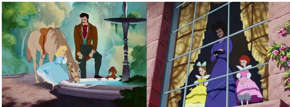
Figura 3. Familia reconstruída y/o extensa de Cenicienta en La Cenicienta (Disney, 1950)