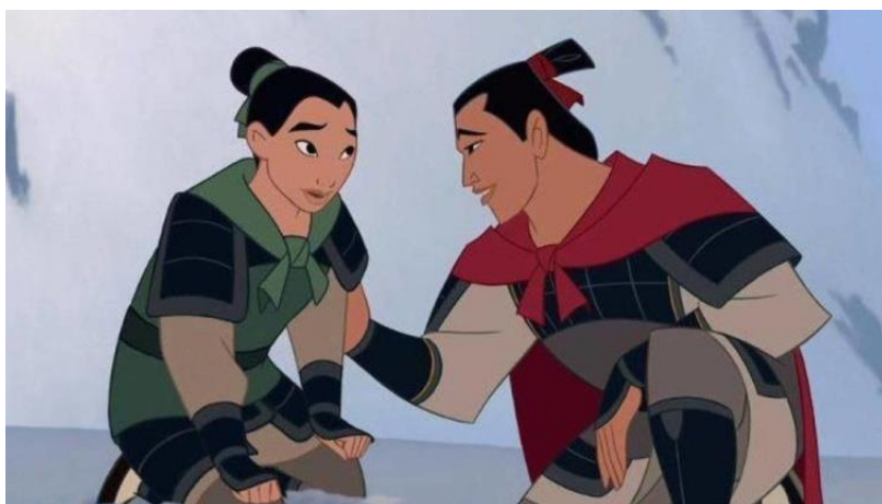
Figura 8. Mulan y Shang como ejemplo de familia sexualmente diversa en Mulan (Coats, 1998)

formación en el ejército desarrolla un vínculo emocional con su capitán Shang de manera recíproca y es precisamente en dicha situación en la que se etiqueta esta familia sexualmente diversa, ya que un hombre se enamora de otra persona con apariencia de varón. Por tanto, aunque de un modo indirecto, se defiende una estructura familiar homosexual. Diversidades como esta deben ser especificadas y presentadas con normalidad en las aulas de Educación Infantil. De no hacerlo, se perpetúan los lastres de una sociedad del heteropatriarcado y defensora de los valores del amor romántico y heterosexual (Barber, 2015).