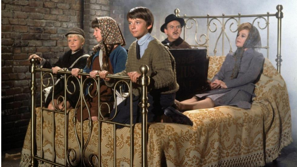
Figura 6. La familia adoptiva de Eglantine Price en La bruja novata (Walsh, 1971)

La cuestión imaginativa: del dibujo y la fotografía a la imagen en movimiento Enero 2021