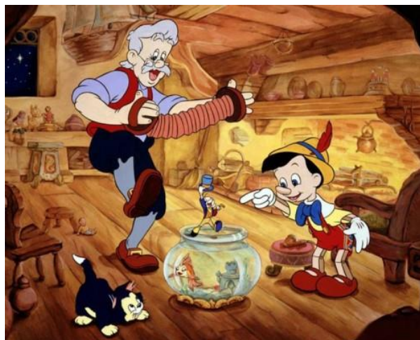
Figura 2. Familia monoparental y con animales de Pinocho en Pinocho (Disney, 1940)

En Pinocho (Disney, 1940) Gepeto es un hombre de edad avanzada quien lamenta no haber formado una familia normativa y disponer de descendencia para compartir su existencia. La noche en la que crea a su nueva marioneta con forma de niño, a quien llama Pinocho, se le concede su deseo y el hada azul otorga vida al títere. Así se inicia una trama en la que Pinocho debe educarse en base a unos principios éticos y sociales que le van a permitir conseguir transformarse en un niño real; disponiendo del apoyo de su nueva familia para ello. Este tipo de familia resulta significativa para ser introducida en el aula de Educación Infantil ya que sirve para desmentir estereotipos centrados en etiquetar a las mujeres con unos roles más relacionados con el cuidado de quienes pertenecen a la infancia mientras que les niega dicha posibilidad a los varones (Guitlin, 2001). Asimismo, en el largometraje también se introduce una idea que relaciona a los animales con miembros de la estructura familiar (Díaz, 2015). De hecho, previamente a Pinocho, Gepeto comparte su cotidianidad con Cleo (un pez) y Fígaro (un gato) a quienes cuida y considera miembros de su familia.