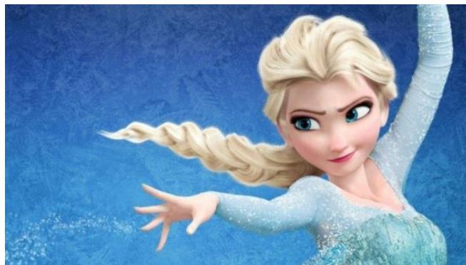
Figura 10. Elsa como ejemplo de familia sin descendencia en Frozen: el reino de hielo (del Vecho y Lasseter, 2013)

La cuestión imaginativa: del dibujo y la fotografía a la imagen en movimiento Enero 2021