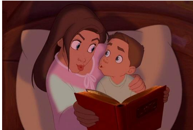
Figura 9. Jim y su madre como ejemplo de familia con progenitores/as separados/as en El planeta del tesoro (Clements, Conli y Musker, 2002)

La cuestión imaginativa: del dibujo y la fotografía a la imagen en movimiento Enero 2021