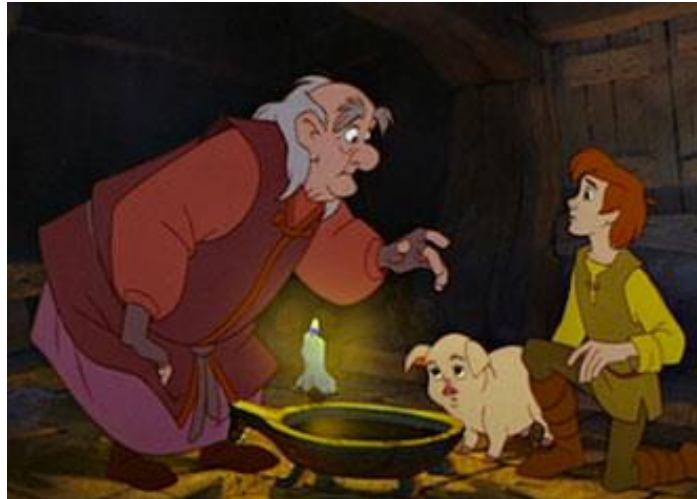
Figura 7. Taron y Dallben como representación de la familia extensa en Taron y el caldero mágico (Hale, 1985)

La cuestión imaginativa: del dibujo y la fotografía a la imagen en movimiento Enero 2021