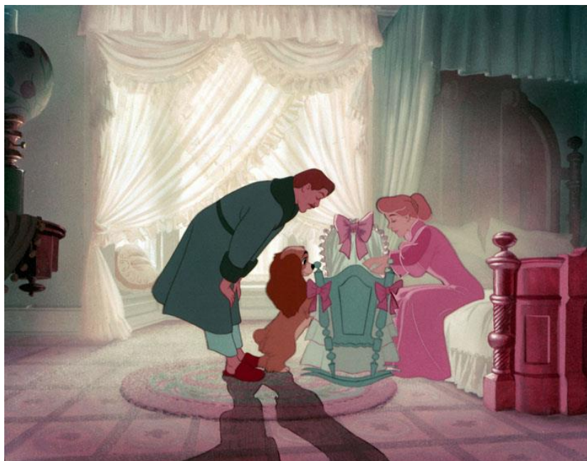
Figura 4. Familia con animales de Reina en La dama y el vagabundo (Disney, 1955)

No obstante, como crítica y/o contraposición se destaca nuevamente la preservación de un modelo de familia nuclear ya que las uniones que se producen parten de dos miembros de sexo opuesto (Arranz, Oliva, Olabarrieta y Antolín, 2010). Esta idea también se presenta entre quienes componen el reino animal. Reina desarrolla una relación amorosa con Golfo, un perro callejero. Además, el fin último de las relaciones se basa en la procreación y la permanencia de la especie. Estas situaciones deben de tratarse con cautela desde las aulas de Educación Infantil, ya que en caso omiso se asimilan mensajes estereotipados en el subconsciente de quienes consumen los largometrajes de manera pasiva (Granado, 2003).