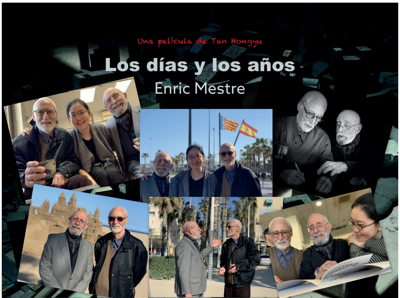
Figura 3.- Collage fotográfico en torno al documental. Valencia, 2019.

Se trata de un documento visual, convertido en aporte y archivo fundamental, por su información, por la vertiente testimonial ejercitada y por la sólida divulgación internacional que implica. ¿Cómo han podido permitirse las estructuras universitarias valencianas, de la Facultad de Bellas Artes de San Carlos, dejar escapar de su claustro docente, una figura tan especial y determinante como el profesor Enric Mestre? Secretos azarosos de la historia, que solo el espejo retrovisor de la investigación podrá quizás, algún día, explicarnos cautelosamente e intentar quizás justificar, soto voce .