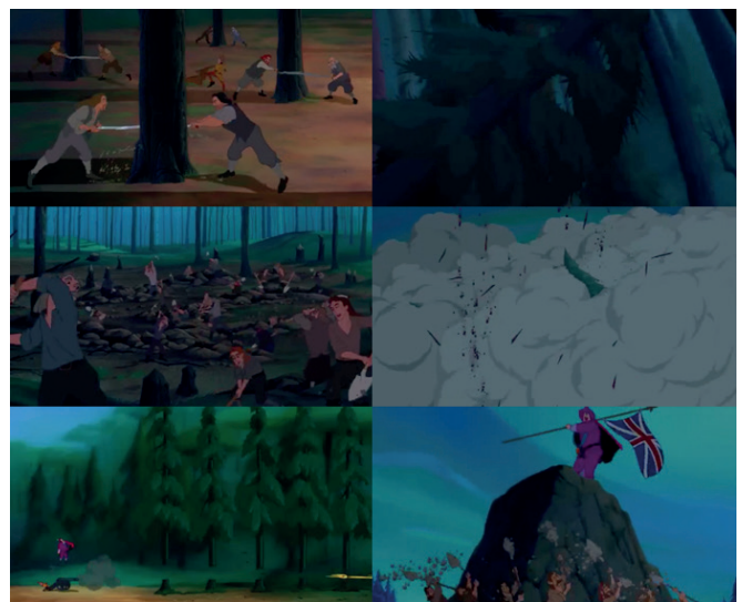
Ilustración 7. Pentecost (1995). Superioridad sesgada de la humanidad con respecto a la naturaleza [Figura]. En Pocahontas (Pentecost, 1995)

Studio Ghibli se funda con Hayao Miyazaki en 1985 (Hernández, 2013); convirtiéndose en una gran potencia oriental y global (Martínez, 2015). Dicha influencia se explica por la atribución de humanismo (Robles, 2013) a quienes las protagonizan y a las historias que se transmiten. De hecho, las producciones de Studio Ghibli se muestran como una alternativa para la educación del colectivo in-