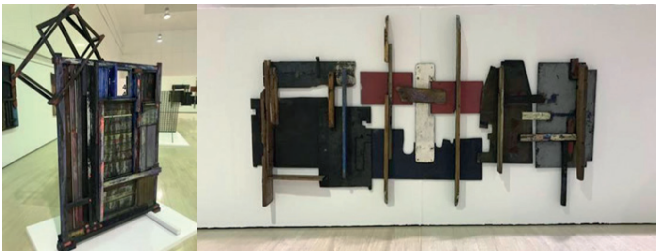
Ilustración 9. Frutos María (2019). Exposición de Frutos María “Acero y pecios del mar” en el MUA (Museo de la Universidad de Alicante) en noviembre 2019 [Figura]

En contraposición, destaca la presencia de Studio Ghibli como productora de animación concienciada con la ecología. Esta le concede un tratamiento indispensable en todas sus producciones, recrea espacios naturales que envuelven las historias, etc., de esta manera asienta un discurso naturalista en la audiencia, quien la considera un elemento indispensable de la propia existencia.