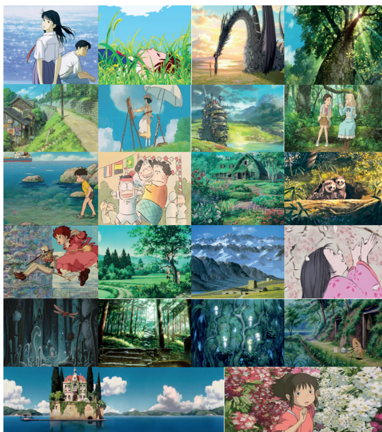
Ilustración 8. Studio Ghibli (1986-2014). Tratamiento de la naturaleza en la productora de animación oriental Studio Ghibli [Figura]