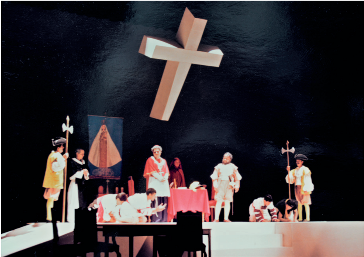
Imagen 2. La obra de teatro Los agravios de su ilustrísima se estrenó en junio de 1992 en el Teatro de la Ciudad en Tuxtla Gutiérrez, Chiapas.

que el alcalde mayor, Martín González de Vergara, tiene deudas económicas con españoles peninsulares y criollos, comerciantes ellos, a los que llama fiadores. Son quienes cobran al alcalde dinero que le han prestado y, además, piden participar en el comercio del maíz, frijol y licor. Es decir, buscan el control de la alcaldía y sitúan en medio de ellos a los indios.