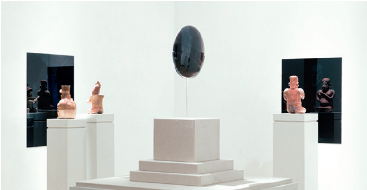
Espejo Negro (2010), Instalación de Pedro Lasch, Centro de Escultura Nasher.

cuerpo. Lo que hace que el sonido que tenga diferentes niveles. Este trabajo hace un llamado a una geopoética del ser desde un pensamiento decolonial. En este caso la pieza se vuelve una obra en proceso ya que deberá traducirse del Maya Q'eqchi' al idioma del lugar donde se exhiba. (Monterroso, 2015)