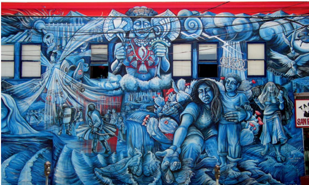
Las Aguas Sagradas de La Llorona (2004), mural de Juana Alicia Araiza.

El muralismo chicano conecta su historia insurgente con su contraparte mexicana de principios de siglo XX, el cual intentaba retomar las dimensiones mesoamericanas y transportarlas a la vida social de México. El muralismo mexicano sirvió de camuflaje a la política clasista y multicultural de Vasconcelos cuando era ministro de educación y se desarrolló, en su mayoría en los interiores de edificios de oficinas estatales. No podemos obviar el intento por re-imaginar la vida sensitiva mesoamericana en las soluciones dimensionales, volumen, colores y movimientos de este periodo que luego le sirvieron a lxs creadores xicanxs para re-imaginar a Aztlán en la calles de muchos barrios del suroeste de Estados Unidos. Cuando las artistas chicanas imaginan, sienten, piensan y realizan un mural, ellas enuncian una protesta en la cual reconocemos una denuncia social de la violencia de la matriz colonial hacia lxs campesinxs, los indígenas, las mujeres, la tierra y la naturaleza. (Robles, 1989)