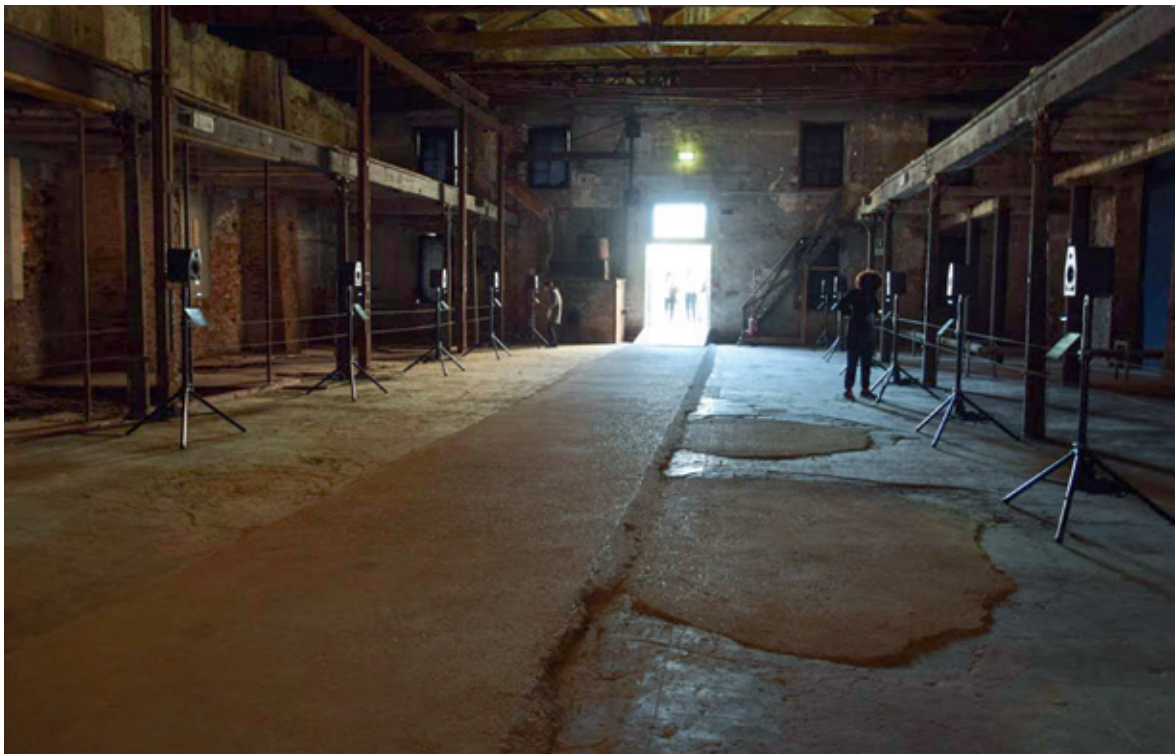
Rokeb' iq' (2015). Instalación sonora de Sandra Monterroso, en “voces indígenas”. 56 Bienal de Venecia.

Reconocer la importancia del sonido en el imaginario decolonial, conlleva discursar sobre como sentir y pensar la sonoridad y el ritmo del lenguaje son claves importantes en nuestra producción creativa insurgente, pues desde la opción decolonial nos resulta urgente “indagar en las relaciones de poder que estructuran a lo sonoro como un régimen