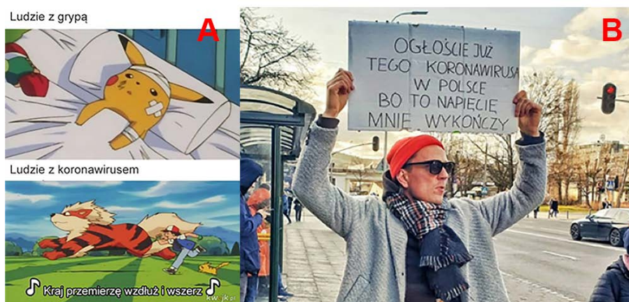
Figura 1. Ejemplos de memes con esquemas narrativos de comedia (a) y tragedia (b)

75 memes representan el esquema de «tragedia», lo cual lo convierte en el tercero más común. El ejemplo de un meme en esta categoría proviene de Facebook (Koronawirus memy, 2020) en el que un joven está de pie junto a una parada de autobús sosteniendo un cartel con el texto: «Anuncia [la existencia] de este coronavirus en Polonia, porque esta tensión será mi fin» (Figura 1 - b). Es un comentario sobre las autoridades polacas y los medios de comunicación públicos que no tomaron en serio los rumores sobre un brote de Covid-19 en Polonia, cuando tales especulaciones fueron reportadas por otros medios, y se registraron infecciones del virus en los estados vecinos.