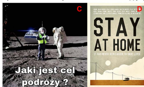
Figura 2. Ejemplos de memes con esquemas narrativos de sátira (c) y épica (d)

El esquema satírico incluye 96 memes y es el segundo tipo de narrativa más frecuente. Un ejemplo de esta narrativa es un meme del Polska Times (2020b) (Figura 2-c) donde una patrulla de policía polaca detiene a un astronauta. El policía pregunta: «¿Cuál es el propósito de su viaje?». El esquema narrativo «épico» fue el menos frecuente (42 memes en total). Sin embargo, cabe señalar que fue la